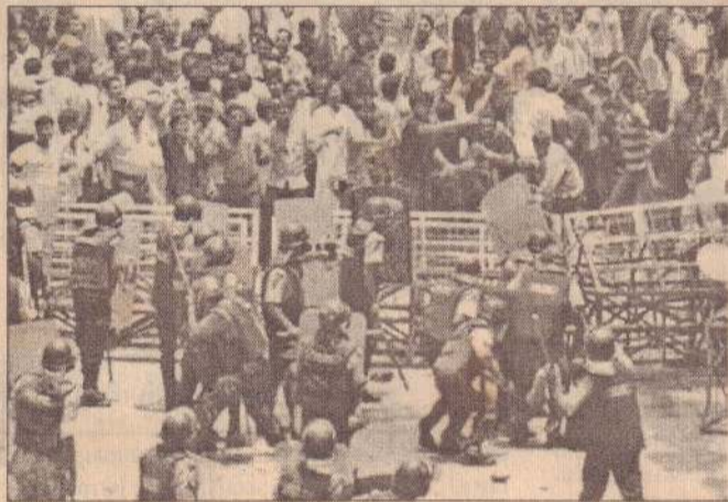
பங்களாதேஷ் தலைநகர் டாக்காவில் எதிர்க்கட்சி ஆதரவாளர்கள் கடந்த செவ்வாய்க்கிழமை தேர்தல் ஆணையாளர் அவ்வலகத்தை நோக்கி ஆர்ப்பாட்டப் பேரணி நடத்தினர். பொலீஸார் அதனைத் தடுத்து நிறுத்திய போது வன்முறை வெடித்தது அப்போது எடுக்கப்பட்ட படம் இது.

கடந்த 8ஆம் திகதி, தேவார்பல்லி கிராமத்தில் பாதுகாப்புப் படையினருக்கும் தீவிரவாதிகளுக்கும் இடையே ஏற்பட்ட மோதலில் பத்து தீவிரவாதிகள் கொல்லப்பட்டனர். பலர் காயமடைந்தனர். இந்தச் சம்பவத்திற்கு பழிக்கு பழிவாங்கும் நடவடிக்கையாகவே, நேற்று முன்தினம் தீவிரவாதிகள் சிக்குவார்குடா கிராமத்தில் புருந்து, அப்பாவி மக்களைக் கொன்று, கிராமத்தையே குறையாடினர் என்று பொலீஸார் தெரிவித்தனர். (202)