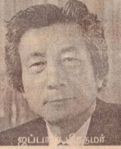
ஜப்பான் பிரதமர் கொய்சுமி பதவியி் விருந்து விலகவிருக்கின்றமை குறிப்பிடத்தக்கது. (ப)

கொய்சுமி அண்மையில் அமெரிக்க அதிபர் ஜோர்ஜ் புஷைச் சந்தித்து விட்டு வந்த பின்னர் இந்த முடிவை எடுத்துள்ளார். இவ்வருடஇறுதியில்