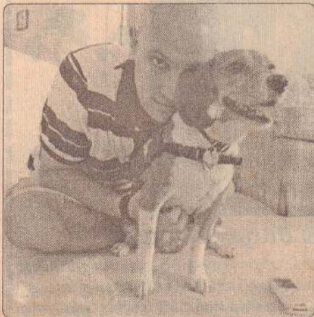
அமெரிக்காவின் புளோரிடா மாநிலத்தில் நோயால் மயங்கி விழுந்த தனது ஏஜமானை பார்த்த பெல்லி என்னும் நாய் உடனடியாக உதவிக்கொண்டது. மூலம் அவசர உதவித் திட்டம் அமைக்கப்பட்டுள்ளது. அப்பகுதியில் தற்போது அவசர நிலை அறிவிக்கப்பட்டுள்ளது. (202)

வாஷிங்டன், ஜூன் 22 தொலைதூரம் பாய்ந்து தாக்கக்கூடிய ஏவுகணைகளை சோதித்துப்பார்க்கும் நிலைக்கு வடகொரியா முன்னேறிக்கொண்டிருக்கிறது. அவ்வாறான ஏவுகணைகள் அமெ