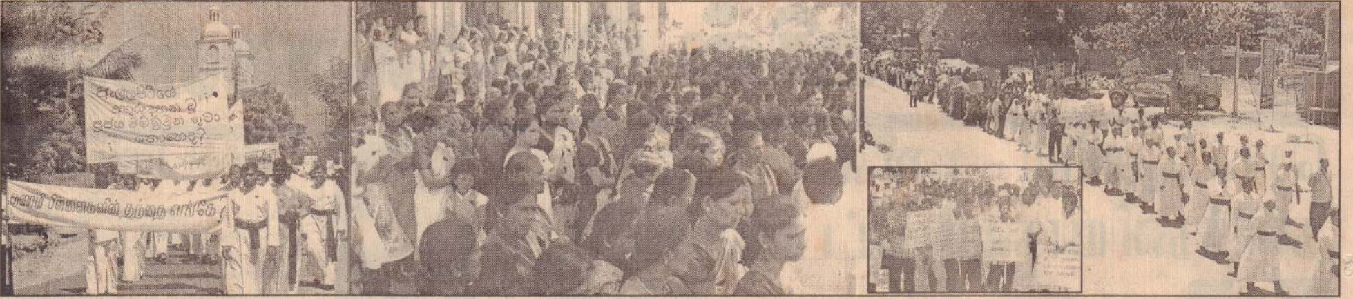
அல்லைப்பிட்டிப் பங்குத்தந்தை அருட்திரு ஜிம்புறவுண் அடிகளாரையும் அவரது உதவியாளரையும் விடுவிக்கக்கோரி மன்னார், புதுக்குடியிருப்பு மாவட்டங்களில் நேற்றையதினம் கண்டனப் பேரணிகள் நடைபெற்றன. முதலிரு படங்களும் மன்னாரில் இடம்பெற்ற பேரணியினையும் அடுத்துள்ள இரு படங்களும் புதுக்குடியிருப்பில் இடம்பெற்ற பேரணியையும் காட்டுகின்றன.