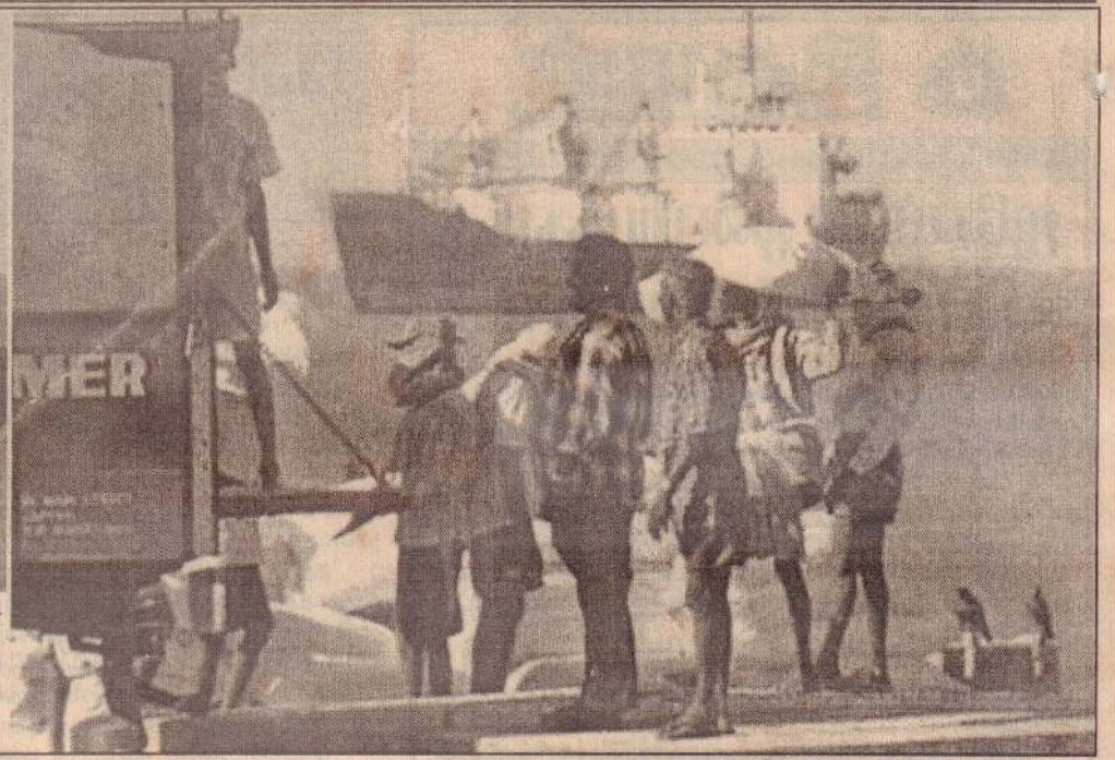
பருத்தித்துறைத் துறைமுகத்தை வந்தடைந்துள்ள றுகுணு கப்பலிலிருந்து பொருள்களை இறக்கும் பணி முழு வீச்சில் இடம்பெற்று வருகிறது. கப்பலிலிருந்து பாஜ்கள் மூலம் பொருள்கள் கரைக்கு எடுத்துவரப்படுவதையும் அவ்வாறு எடுத்துவரப்பட்ட பொருள்கள் லொறிகளில் ஏற்றப்படுவதையும் படங்களில் காணலாம்.