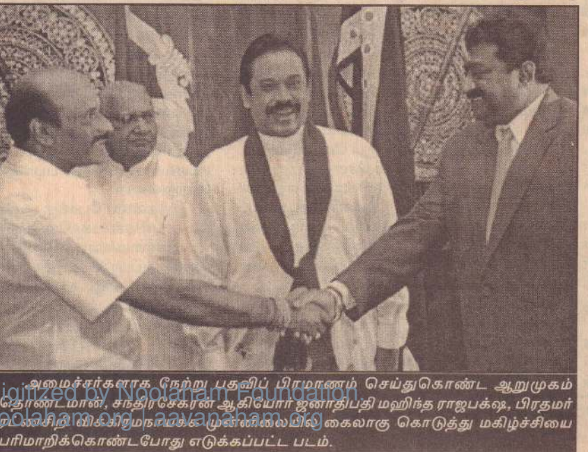
அமைச்சர்களாக நேற்று பதவிப் பிரமாணம் செய்துகொண்ட ஆறுமுகம் தொண்டமான், சந்திரசேகரன் ஆகியோர் ஜனாதிபதி மஹிந்த ராஜபக்ஷ, பிரதமர் நவாஹ் விக்கிரமநாயகம் முன்னிலையில் கைலாகு கொடுத்து மகிழ்ச்சியை பரிமாறிக் கொண்டபோது எடுக்கப்பட்ட படம்.

இதேவேளை, குடநாட்டிலுள்ள மக்கள் வங்கிக் கிளைகளுக்கு ஒருதொகைத் திரவயணம் கொழும்பிலிருந்து எடுத்துவரப்பட்டுள்ளதாகத் தெரிவிக்கப்பட்டது. (1)