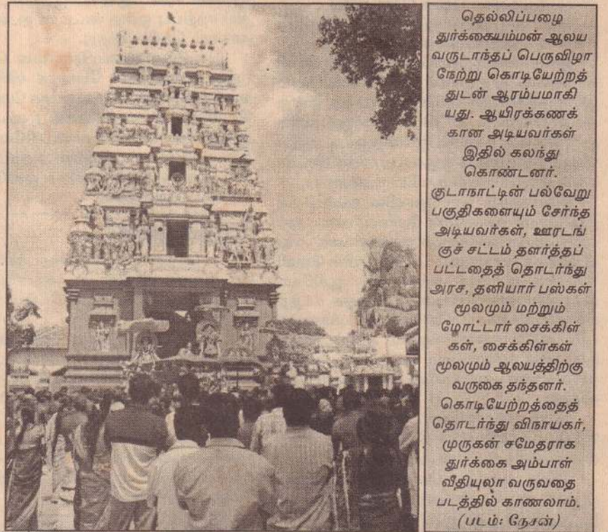
தெல்லிப்பழை தூர்க்கையம்மன் ஆலய வருடாந்தப் பெருவிழா நேற்று கொடியேற்றத் துடன் ஆரம்பமாகியது. ஆயிரக்கணக்கான அடியவர்கள் இதில் கலந்து கொண்டனர். குடநாட்டின் பல்வேறு பகுதிகளையும் சேர்ந்த அடியவர்கள், ஊரடங்குச் சட்டம் தளர்த்தப்பட்டதைத் தொடர்ந்து அரசு, தனியார் பல்கள் மூலமும் மற்றும் மோட்டார் சைக்கிள்கள், சைக்கிள்கள் மூலமும் ஆலயத்திற்கு வருகை தந்தனர். கொடியேற்றத்தைத் தொடர்ந்து விநாயகர், முருகன் சமேதராக தூர்க்கை அம்பாள் வீதியுலா வருவதை படத்தில் காணலாம்.

* ஊர்காவற்றறை, அல்லைப்பிட்டி, மிருசுவில் ஆகிய பகுதிகளுக்குச் சென்று நிவாரணப் பணிகளை மேற்கொள்ள அரசு சார்பற்ற அமைப்புகளுக்கு அனுமதி வழங்கப்பட வேண்டும். (1)