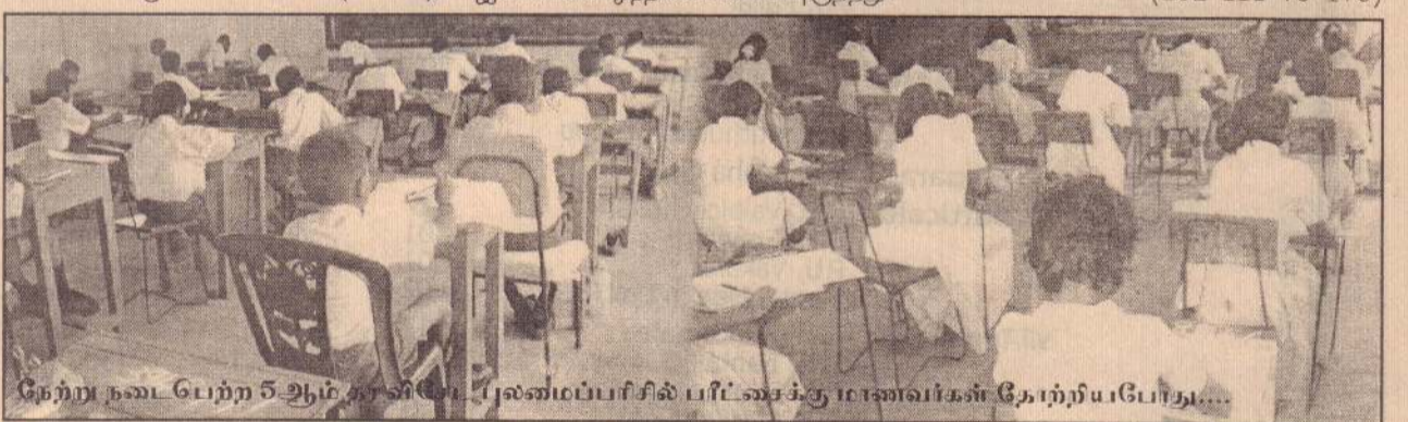
நேற்று நடைபெற்ற 5 ஆம் தர விசேட புலமைப்பரிசில் பரீட்சைக்கு மாணவர்கள் தோற்றியபோது....

பரீட்சைக்கு மாணவர்களை அழைத்து வந்த பெற்றோர்கள் பரீட்சை முடியும் வரை காத்திருந்து அவர்களை அழைத்துச் சென்றதை அவதானிக்கக்கூடியதாக இருந்தது. (202-111-79-173)