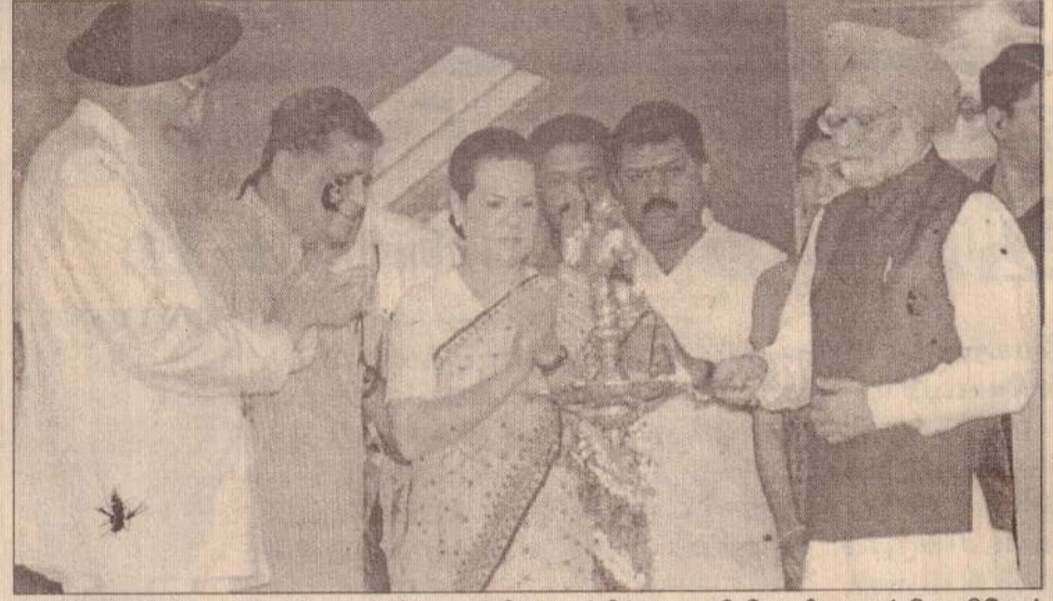
இந்தியப் பிரதமர் மன்மோகன் சிங், காங்கிரஸ் கட்சித் தலைவி சோனியா காந்தி ஆகியோர் நேற்று தமிழகத்துக்கு விஜயம் செய்தனர். காஞ்சிபுரம் ஓரகடம் என்ற இடத்தில் இடம்பெற்ற தேசிய வாசன ஆராய்ச்சி மையத்துக்கான அடிக்கல் நட்டும் நிகழ்வில் கலந்துகொள்வதற்காகவே இவர்கள் தமிழகத்துக்கு வருகைத்தந்தனர். இது தொடர்பான நிகழ்வில் அவர்கள் கலந்துகொண்டபோது எடுக்கப்பட்ட படம் இது. தமிழக ஆளுநர் பர்னாலாவும் படத்தில் காணப்படுகிறார்.

உள்ளூராட்சி சபைகளில் கடமையாற்றும் இணைந்த சேவைகள் தரம் I ஐச் சேர்ந்த உத்தியோகத்தர்கள் முகாமைத்துவ உதவியாளர் தரம் I இல் கடமையாற்றி வருவதும் - இணைந்த சேவை தரங்களில் எழுதுநர் சேவை, சுருக்கெழுத்தாளர் சேவை, தட்டெழுத்தாளர் சேவை, கணக்குப் பதியுநர் சேவை, சிறப்பர் சேவை, களஞ்சியப் பொறுப்பாளர் சேவை ஆகியவற்றைச் சேர்ந்த உத்தியோகத்தர்கள் முகாமைத்துவ உதவியாளர் சேவைகளுக்குள் உள்ளீர்க்கப்பட்டுள்ளமையும் குறிப்பிடத்தக்கது.