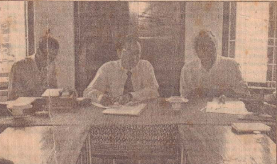
நேற்று யாழ். வருகை தந்த கடற்றொழில் நீரியல் வள அமைச்சின் பணிப்பாளர் நாயகம் ஜி.பியசேன திணைக்களத்தின் யாழ். அலுவலகத்தில் கலந்துரையாடலில் கடுப்பப் பொது எடுக்கப்பட்ட படம். இதுதொடர்பான செய்திகள் 2ஆம், 15ஆம் பக்கங்களில்.

அண்மைக் காலங்களில் ஆழிப்பேரலை நிவாரண நடவடிக்கைகளில் அரசு கையாளும் முறைகளை வன்மையாகக் கண்டித்து வருவதும் அரசினால் நிவாரண நடவடிக்கைகளுக்கான ஏற்படுத்தப்பட்ட உயர்மட்டக் குழுவில் விடுதலைப் புலிகளின் பங்களிப்பினை எதிர்த்து வருவதும் குறிப்பிடத்தக்கது. என்று அந்தச் செய்தியில் மேலும் தெரிவிக்கப்பட்டுள்ளது. (16)