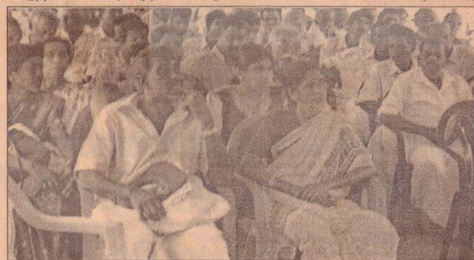
ஓட்டுசுட்டான் கமநலச்சேவை நிலையத்தில் அண்மையில் சிறந்த விவசாயிகளைக் கௌரவிக்கும் நிகழ்வு கிடம்பெற்றது. அந்த நிகழ்வில் கலந்துகொண்ட தெரிவுசெய்யப்பட்ட விவசாயிகளையும் ஏனைய விவசாயிகளையும் படத்தில் காணலாம்.