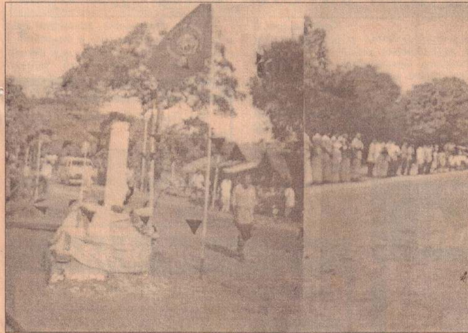
கனாமி அனர்த்தத்தினால் உயிரிழந்த மக்களுக்கு அஞ்சலி செலுத்தும் நிகழ்வு கடந்தவாரம் விசுவாடுப் பிரதேசத்தில் கிடம்பெற்றது. இந்நிகழ்வில் தேசியக்கொடி அரைக்கம்பத்தில் பறக்கவிட்டிருப்பதை முதலாவது படத்திலும், அங்கு கலந்துகொண்டவர்களில் ஒரு பகுதியினரை கிரண்டாவது படத்திலும் காணலாம்.