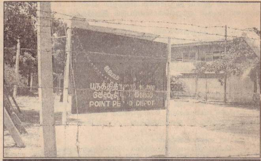
சேதமாக்கப்பட்ட பருத்தித்துறை சாலைப் பெயர்ப்பலகை.

நேற்று அதிகாலை 3 மணிளளவில் இனந்தெரியாதவர்கள் சிலர் தடிகள், கொட்டிகள் போன்றவற்றுடன் வந்தனர். அவர்கள் பாதுகாப்பு உத்தியோகத்தரை மிரட்டி விரட்டினர். பின்னர் பெயர்ப்பலகையில் இருந்த 'வானேந்திய சிங்கம்' சின்னம் மீது தார், கழிவொயில்