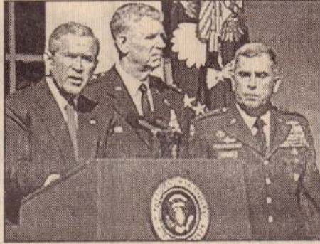
சக்திக்குட்பட்ட எல்லாவித முயற்சிகளையும் தீவிரவாதிகள் எடுப்பார்கள் என்று நாம் எதிர்பார்க்கலாம். ஆனால், எமது படைகள் அதற்குத் தயாராகவே இருக்கின்றன என்று புஷ் கூறியுள்ளார்.

வாஷிங்டன், செப். 30 ஈராக்கில் அடுத்தமாதம் நடைபெற விருக்கும் புதிய அரசியல் யாப்பின் மீதான பொதுசன வாக்கெடுப்புக்கு முன்னர் அங்கு தீவிரவாதிகள் தமது தாக்குதல்களை முடுக்கி விடக்கூடும் என்று அமெரிக்க அதிபர் ஜோர்ஜ் டபிள்யூ புஷ் எச்சரித்துள்ளார். எவ்வாறான தாக்குதலையும் எதிர் கொள்ள அமெரிக்க - ஈராக்கியப் படைகள் ஆயத்தமாகவிருப்பதாகவும் அவர் கூறியுள்ளார்.