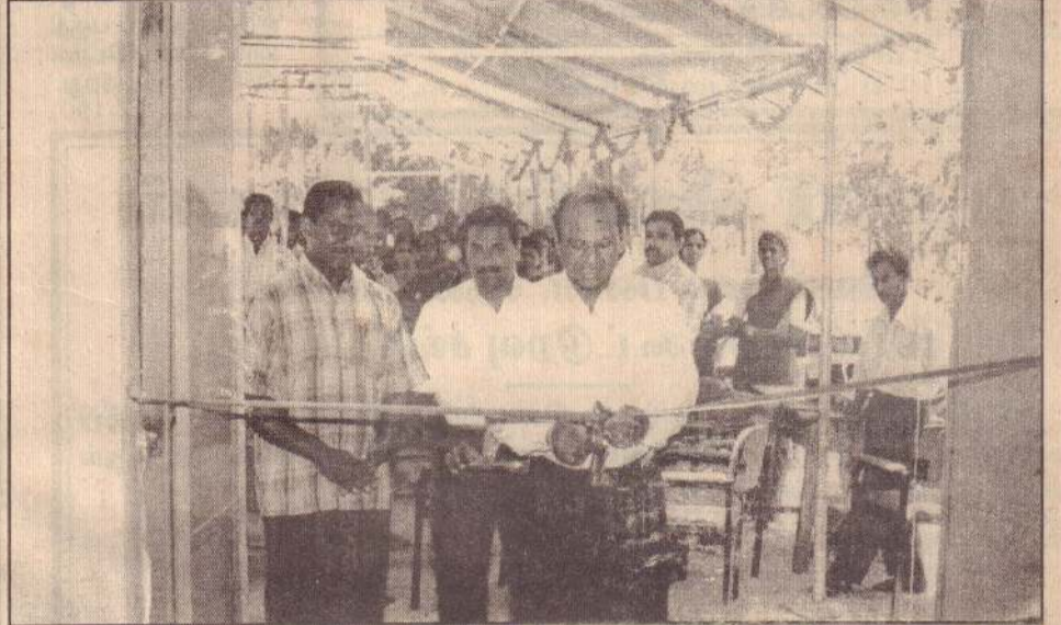
முல்லைத்தீவு மாவட்ட சிக்கன கடனுதவிக்க சூட்டுறவுச் சங்கத்தின் இரண்டாவது கிளை புதுக்குடியிருப்பில் அண்மையில் திறந்துவைக்கப்பட்டது.

இதனால் விலையைத் தெரிந்துகொள்ள முடியாமல் உள்ளது. இதனால், விலைப்பட்டியல்களை உரிய முறையில் பார்வைக்கு வைக்க உரியவர்கள் தகுந்த நடவடிக்கை எடுக்கவேண்டுமென கோரிக்கை விடுக்கப்பட்டுள்ளது. (ஒ-341-204)