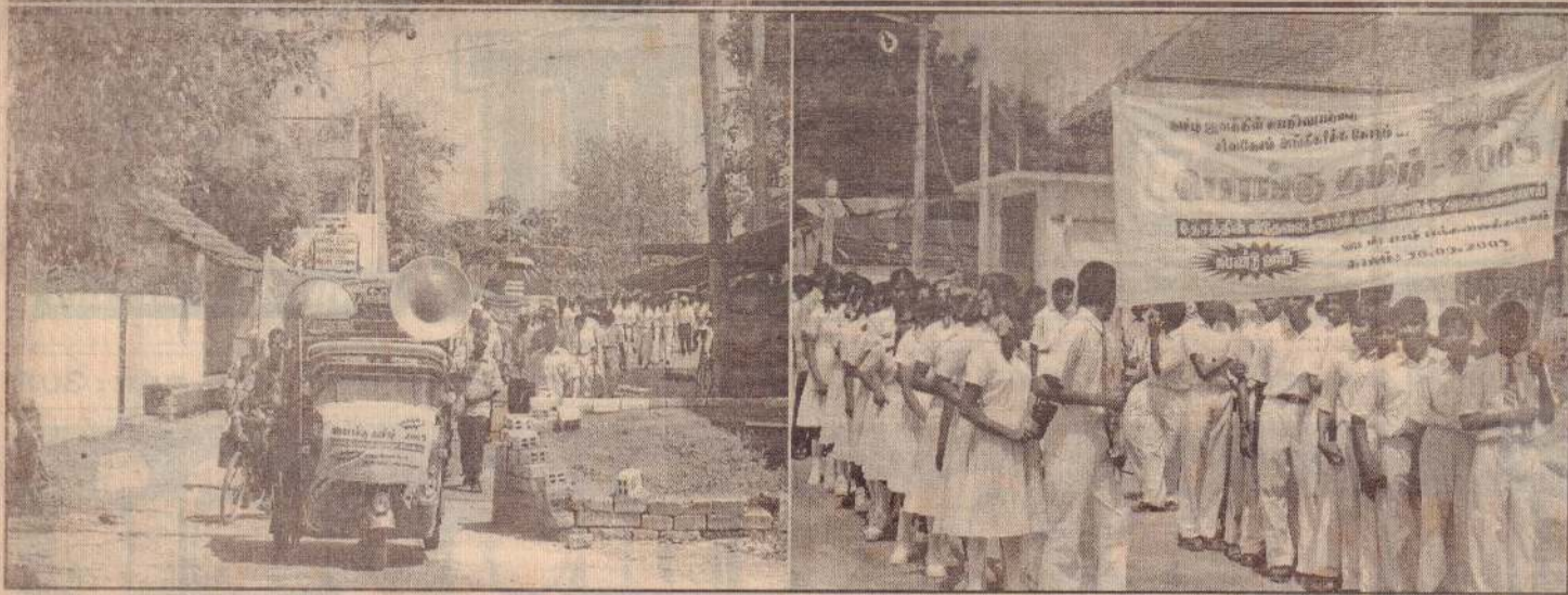
பொங்குதமிழில் மக்களை அணிதிரளுமாறு கோரி வடமராட்சிப் பகுதி மாணவர் ஆரம்பித்த பேரணி நேற்று யாழ். பல்கலைக்கழகம் நோக்கி புறப்பட்டபோது எடுக்கப்பட்ட படங்கள்.