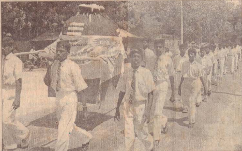
பொங்குதமிழுக்கு அணி சேர்க்கும் வகையில் வடமராட்சி மாணவர்கள் நேற்று ஆரம்பித்த பேரணியை படத்தில் காணலாம். (மேலும் படங்கள் 2ஆம் பக்கத்தில்)

வீதிகளில் குழுமிநின்ற மக்கள் யாத்திரைக் குழுவினருக்கு நீராகாரம் வழங்கினர். (6-9)