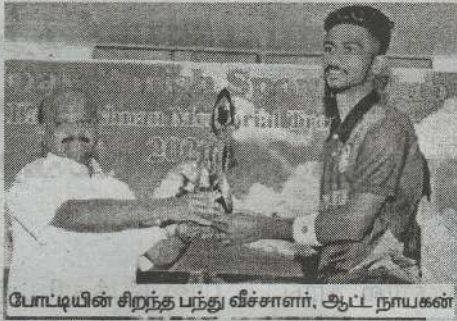
போட்டியின் சிறந்த பந்து வீச்சாளர், ஆட்ட நாயகன்