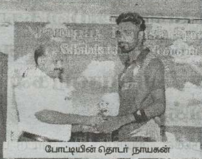
போட்டியின் தொடர் நாயகன்