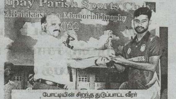
போட்டியின் சிறந்த துடுப்பாட்ட வீரர்