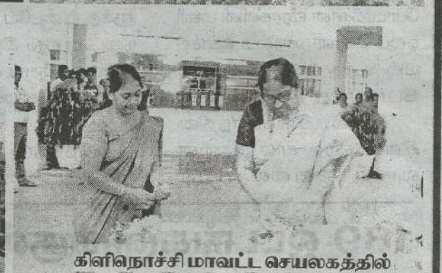
கிளிநொச்சி மாவட்ட செயலகத்தில்