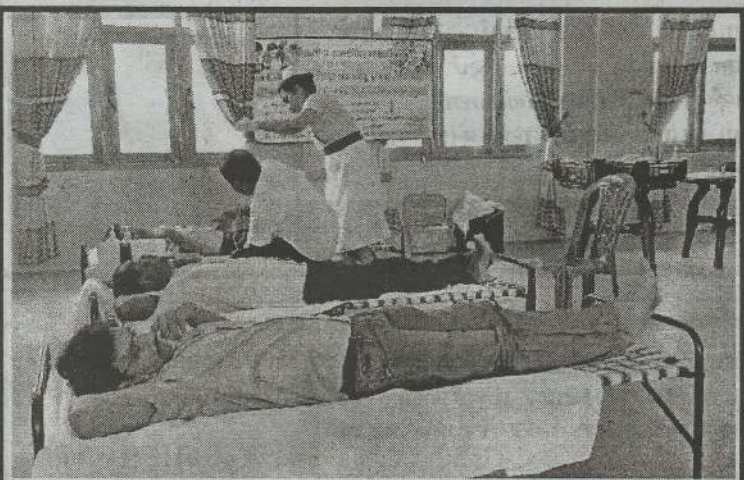
2022 ஆம் ஆண்டு வாசிப்பு மாதத்தினை முன்னிட்டு வலிகாமம் மேற்கு பிரதேச சபையின் மண்டபத்தில் மாபெரும் இரத்ததான நிகழ்வு அண்மையில் நடைபெற்றது.

கைது செய்யப்பட்ட இளைஞனை பொலிஸ் நிலையத்தில் தடுத்தது வைத்து பொலிஸார் மேலதிக விசாரணைகளை முன்னெடுத்து வருகின்றனர். (6-33)