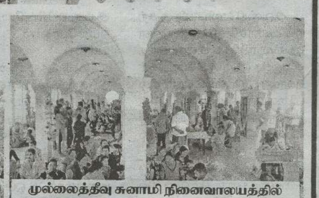
முல்லைத்தீவு சுனாமி நினைவாலயத்தில்

சுனாமி அனர்த்தம் இடம்பெற்ற 18 ஆம் ஆண்டு நினைவு தினமான நேற்று தேசிய பாதுகாப்பு தினம் நாடு முழுவதும் அனுஷ்டிக்கப்பட்டுள்ளது.