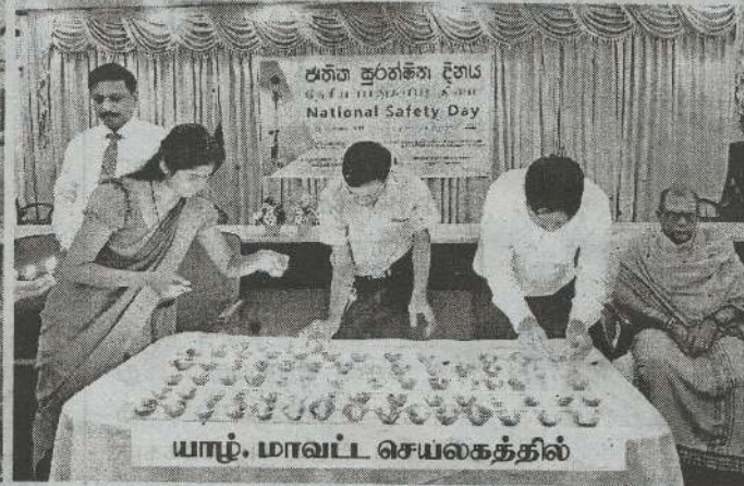
யாழ்ப்ப. மாவட்ட செயலகத்தில்