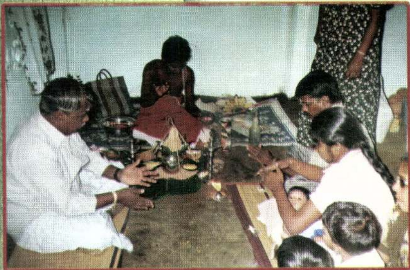
பேர்ப்பிள்ளையின் 31 நிகழ்வின் போது....