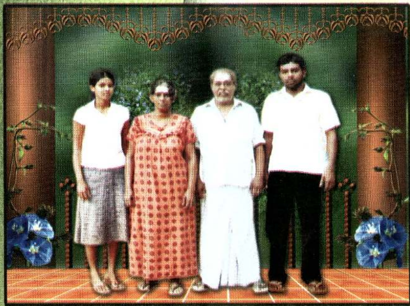
மனைவியுடனும் இரு பிள்ளைகளுடனும்....