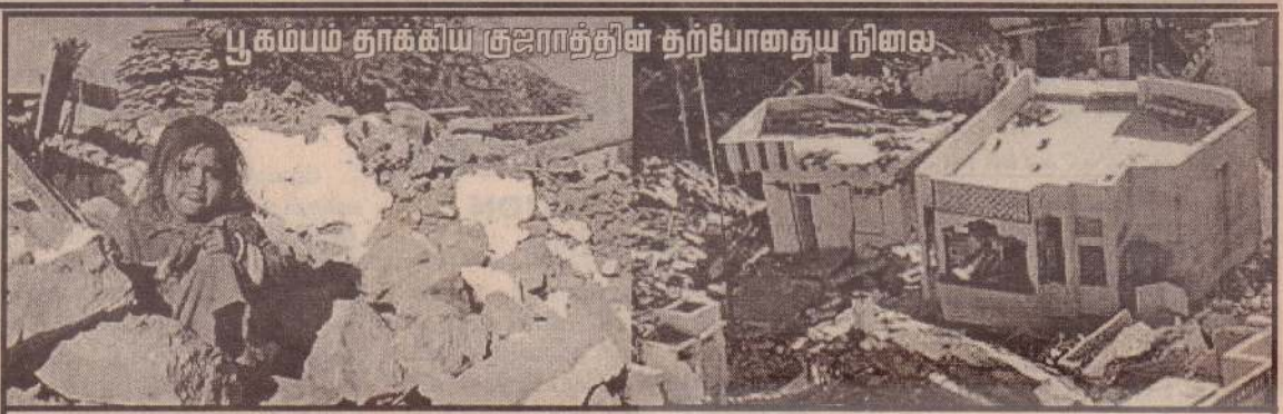
புகம்பம் தாக்கிய குஜராத் திற்போதைய நிலை இந்தியாவின் குஜராத் மாநிலம் கடந்த ஆண்டு பெரும் புகம்பத்தால் தாக்கப்பட்டு மிக மோசமான பாதிப்புக்களை சந்தித்தது. கிழவரை அந்த மாநிலம் புகம்ப பாதிப்புக்களிலிருந்து முழுமையாக மீண்டு வரவில்லை. புகம்பத்தால் கடந்த ஆண்டு கிடிந்து சீதைந்துபோன தனது வீட்டு கிடிபாடுகளுக்கு மத்தியில் சீறும் ஒருத்தர் அமர்ந்திருப்பதையும், ஒருவருட்குக்கு மேலாகியும் பாதிக்கப்பட்ட பிரதேசம் புனரமைப்புச் செய்யப்படாமல் சீதைந்து கிடப்பதையும் படங்களில் காணலாம்.

மிக மோசமான நிலையில் இருந்த அவரது உடல் நிலையைச் சீர்ப்படுத்த மருத்துவர்கள் தீவிர முயற்சிகளை மேற்கொண்டனர். எனினும் சிகிச்சைகள் எவையும் பயனளிக்காமல் நேற்று அதிகாலை அவர் மரணமானதாக அறிவிக்கப்பட்டுள்ளது. இளவரசர் திபேந்திரா தன்னைத் தானே சுட்டுக் கொண்டதாக முதலில் வந்த செய்திகள் தெரிவித்தன. ஆனால் அவரது முதுகில் குட்டுக்காயங்கள் காணப்பட்டதாகத் தெரிவிக்கப்படுகின்றது. இதனால் இளவரசரது மரணம் தொடர்பாக சந்தேகங்கள் எழுப்பப்பட்டுள்ளன. (ம)