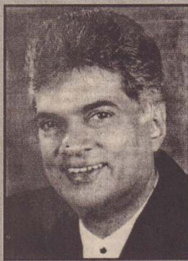
(08ஆம் பக்கம் பார்க்க)

அமைச்சுப் பொறுப்புக்களை யார் யாருக்கு வழங்குவது எத்தனை அமைச்சர்களை நியமிப்பது என்பன தொடர்பாக ரணில் விக்கிரமசிங்க கட்சித் தலைவர்களுடன் கூல்துரையாடி வருவதாகத் தெரிவிக்கப்படுகிறது. புதிய அமைச்சரவையில் பெரும்பாலும் 35 அமைச்சர்கள் இடம்பெறும் (08ஆம் பக்கம் பார்க்க)