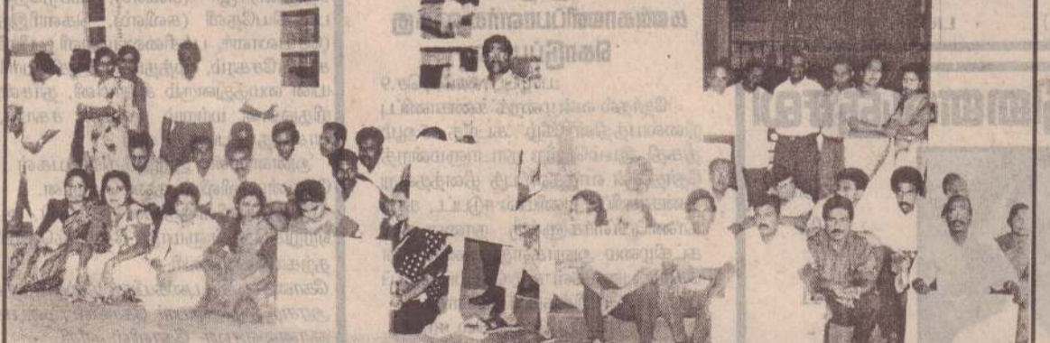
யாழ்ப்பல்கலைக்கழக விரிவுரையாளர் தேர்தல் தினத்தன்று தாக்கப்பட்டதைக் கண்டித்து பல்கலைக்கழக ஆசிரியர் சங்கத்தினர் நேற்றுமுன்தினம் நடத்திய ஆர்ப்பாட்டத்தின்போது எடுக்கப்பட்ட படங்கள்.