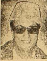
எம். ஜி. ஆர்.

துக் கழகத் தலைவர் பதவி யில் இருந்து ஓய்வு பெற்ற வங்களை அப்போது அவர் நினைவு கூர்ந்தார். அவை இங்கு தொகுத்துக் தரப்படுகிறது.