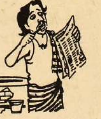
அப்ப... ஆளுநர்பாடு பெருந்திட்டாட்டம் தான்...!

வவுனியா, மார்ச் 22 உன்னா நோன்பிருந்து உயிர் நீத்த அன்னை நூபதியின் நினைவாக வவுனியா மாவட்டத்திலும் பல ஏழுச்சி மிகு நிகழ்ச்சிகள் இடம்பெற்று வருகின்றன. வவுனியா நகரம் உட்பட கிராமப்புறங்கள் எங்கும் அவரது நிழற்படங்கள் வைக்கப்பட்டு தோரணம் கட்டி, வாழைமரங்கள் நட்டு அஞ்சலிக்கூட்டங்களும் மொளையாஞ்சலி நிகழ்ச்சிகளும் நடைபெற்று வருகின்றன. புலிகளின் மக்கள் முன்னணி பிரமுகர்கள், ஊர்ப் பிரமுகர்கள் அன்னையின் அன்புபரியதியாகத்தை நினைவுகூரும் வகையில் சொற்பொழிவுகள் நிகழ்த்தி வருகின்றனர். "எமது மக்கள் இன்னல் முச்சந்தி முரளி"