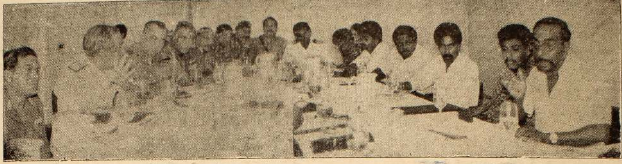
நேற்று பலாலியில் இடம்பெற்ற சந்திப்பில் பங்குகொண்ட விடுதலைப் புலிகளின் பிரதிநிதிகளையும், முப்படைகளின் தளபதிகளையும் அதிகாரிகளைப் பதத்தில் காணலாம்.

நகரில் மழை யாழ்ப்பாணம் மார்ச் 29 நண்டகால இடைவெளியின் பின்னர் யாழ்ப்பாண நகரத்திலும், குடாநாட்டின் ஏனைய சில பகுதிகளிலும் நேற்றுப் பிற்பகல் மழை பெய்தது. சுமார் அரை மணி நேரமாகக் கணிசமான அளவு மழை பெய்தது. [அ] திருமலையில் கொள்ளை! திருகோணமலை மார்ச் 29 திருகோணமலை மட்டிக்களிப்பகுதியில் மீன் ஏற்றி வந்த லொரி ஒன்று மறிக்கப்பட்டு 96 ஆயிரம் ரூபா கொள்ளையிடப்பட்டது. இந்தச் சம்பவம் நேற்று இடம்பெற்றது. [உ]