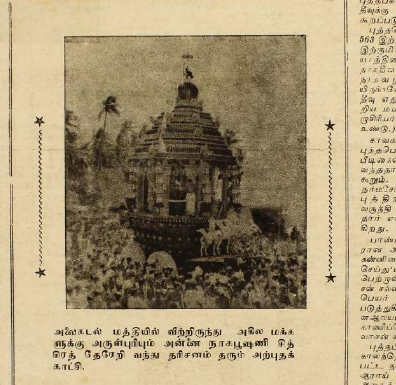
அலைகடல் மத்தியில் வீற்றிருந்து அகில மக்களுக்கு அருள்பிரியும் அன்னை நாகபூஷணி சித்திரத் தேரேறி வந்து தரிசனம் தரும் அற்புதக் காட்சி.

புத்தகோயில் நயினையில் புத்தகர் சமர்திக் கோயில் 1930 - 40 காலகட்டத்தில் ஏற்பட்டது. 1947 இல் விசாரை கட்டப்பட்டது. 1954 இல் புத்தக விகிதம் பர்மா விடுதலு கொண்டு வரப்பட்டது. 1958 ஆம் ஆண்டு அன்றைய அரசு புத்தக கோயிலைப் புனரமைப்புச் செய்தது. 1919 இல் நயினையில் பள்ளிவாசல் கட்டப்பட்டது. 1890 இல் புரட்டல்தாந்து மததேவாலயம் வீடு என்பன கட்டப்பட்டன. சர்வமத சந்தியாக வின் பவலினம் என்று மிளிர்கிற நயினை.