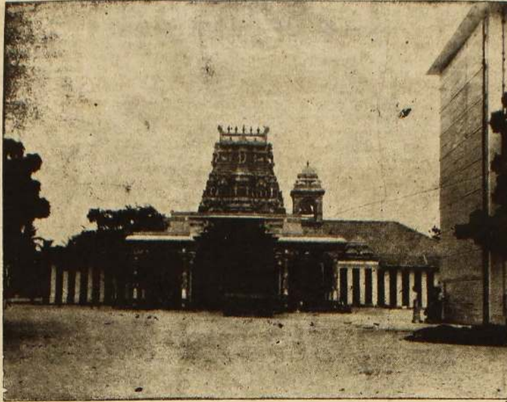
நயினா நாகபூஷணி அம்பாளின் ஆலயத்தோற்றம்