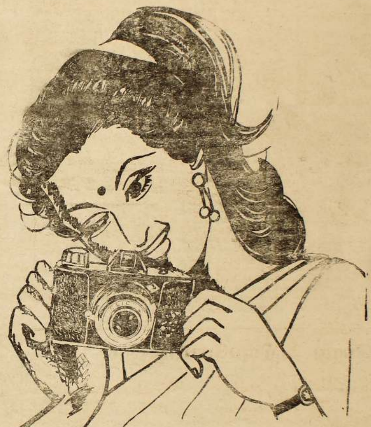
கமராவைக் கையில் மிடித்து எவரும் படம் எடுக்கலாம்...

.... ஆனால் கலையாசத்தடிகள் தரமான படம் மிடிப்பது என்பது ஒரு கலை. எல்லோராலும் அது முடியாது.