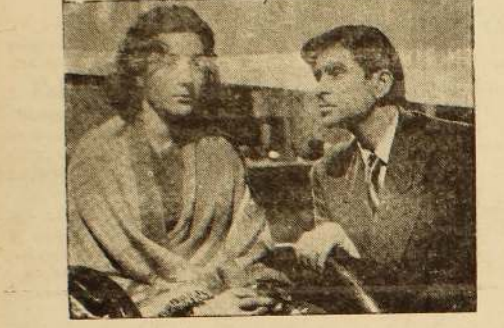
1950 இல் காதல்

அறிவு ஆக்கும் தரும், அழிவும் தரும். அறிவியலும் அப்படித்தான். அறிவியல் சார்ந்த திரைப்படம் சில பயன் தரினும், பல கேள்வியும் தருகிறது. திரைப்படத்தையின் செல்வாக்குப் பல துறைகளையும் பாழடித்து வருகிறது. பல ஆண்டு கால சட்டக்கு உடல், பொருள், ஆவி அனைத்தையும் கொடுத்துத் தொல்வரை பொது அறிவு விஞ்ஞானிகள் திருந்து சாகித்யம்; ஆனால் எவ்வித அரசியல் பணி