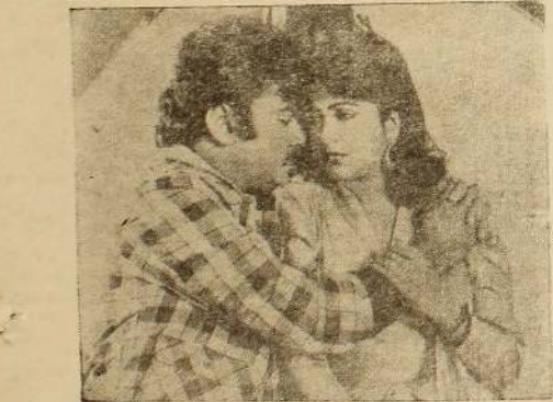
1988 இல் காதல்

திரைப்படத்தில் ஆபாசம் களையப்படவேண்டிய ஒன்று. அதுகூட ஓரிகு நொடிகளில் மறையக்கூடிய, சொட்டகைக்குச் சென்று பார்க்கும் சிலரை மட்டுமே டுக்கும் காட்சி. அதனைச் சுவரொட்டி மூலம் நிலையாகக் காணவைப்பது மீவும் இழிவானதாகும். திரைப்படங்களில் ஆபாசம் பற்றிய ஒரு கண்ணோட்டம் இங்கு பிரசுரமாகிறது. எழுதியவர்: இறையரசன்