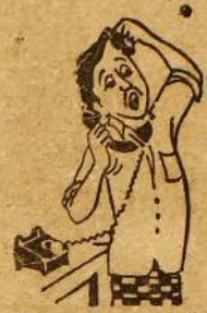
உவர் பண்காட்டு 'நரி' சிம்மரால் சலசலப்புக்கு அஞ்சுவாரோ.....!

கப்பல் மூலம் பொருள்கள் தொடர்ந்து அனுப்பப்படும்