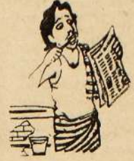
என்னத்தைச் சொன்னான் செய்தாலும் மாணசபைத் தேர்தலை நடத்திப் போட்டேன் என்று வீரப்பப் பேசுவீனம் இனி...