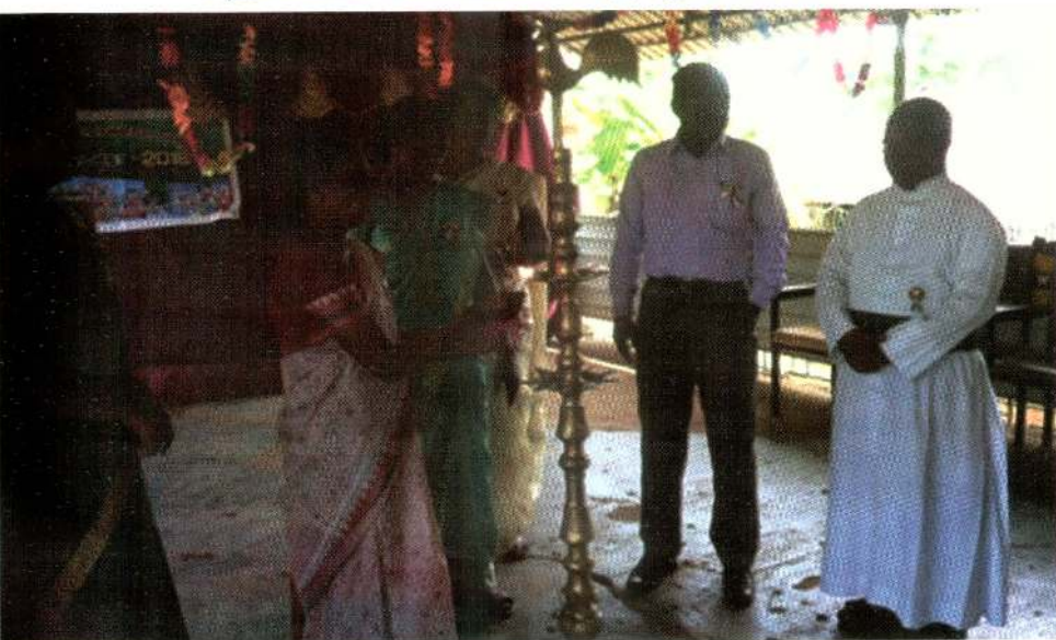
விருந்தினராக அங்கீகரிக்க இடையதால் அழகனார், குருகுதலர், கிளி, முகை மறைக்கோட்டம்.