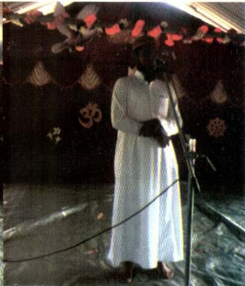
இஸ்லாம் மத தலைவர்