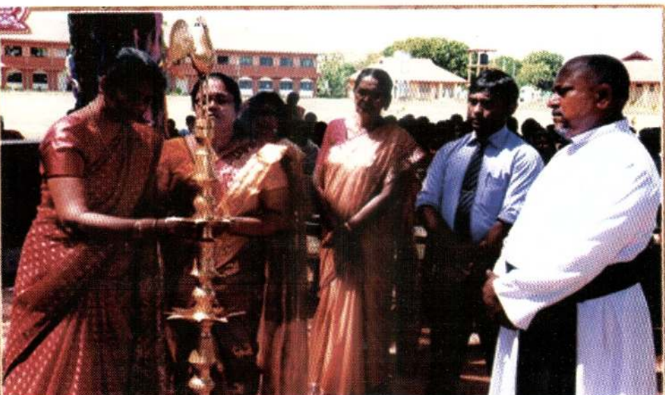
அருட்தந்தை எரித் மூலாங்க அடிகளார்