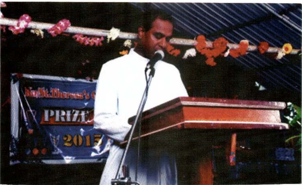
அடுத்ததை ஜோம்ஸ் அடிகளார் மயக்குத் தந்தது, கிளெனொச்சி