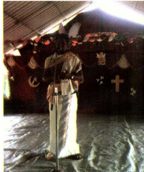
இர்து மத தலைவர்