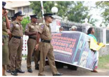
இதற்கு எதிர்ப்பு வெளியிட்ட காணாமல் ஆக்கப்பட்டவர்களின் உறவினர்கள்.

இதனையடுத்து போராட்டத்தில் ஈடுபட்டிருந்த காணாமல் ஆக்கப்பட்டவர்களின் உறவினர்களோடு போராட்டம் இடம்பெறும் இடத்துக்கு வருகை தந்து கலந்துரையாடலில் ஈடுபட்டிருந்த ஓ.எம்.பி. அலுவலக ஆணையாளர்கள் பதிவு நடவடிக்கைகள் டூர்த்தி செய்யவேண்டும். அதன் பின்னர் விசாரணைகள் மேற்கொள்ள வேண்டும் ஆகவே இன்றைய (நேற்றைய) பதிவு நடவடிக்கையில் கலந்துகொண்டு உங்கள் விவரங்களை வழங்கி ஒத்துழைப்பு வழங்குமாறு கேட்டுக்கொண்டனர்.