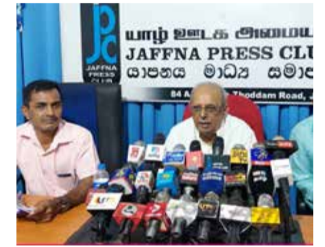
இதனால் இளைஞர், யுவதிகள் நாட்டை விட்டு வெளியேறி வருகின்றனர்.

என்சிசி - சோபா ஒப்புநடுத்தை நிறைவேற்ற இரகசியமாக வேலைகள் இடம்பெற்று வருகின்றன. அவ்வாறான நிலை ஏற்படுமானால், அமெரிக்க இராணுவம் வந்து, நிலைமை இன்னும் மோசமாகும். அதன் பின்னர் அவர்களுக்கு எதிராக எதுவும் செய்ய முடியாது.