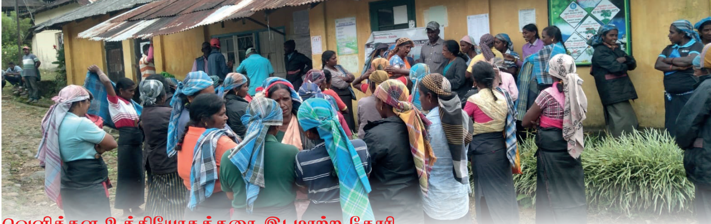
வெளிக்கள உத்தியோகத்தரை இடமாற்ற கோரி