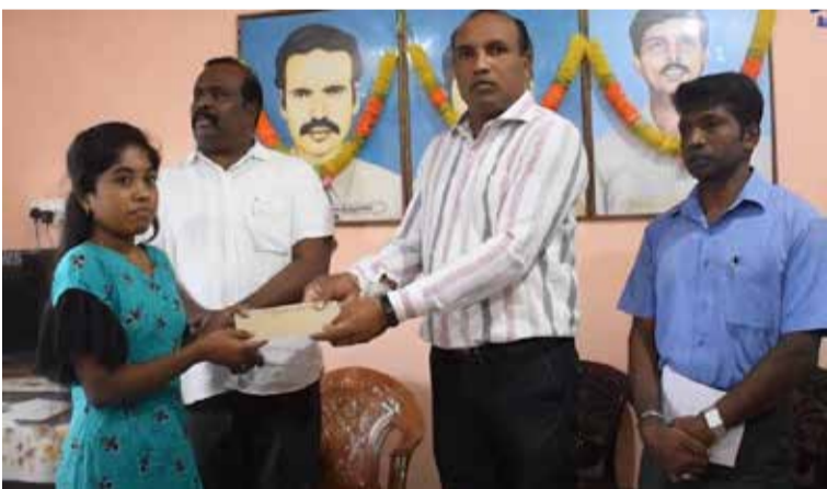
மன்னார், டி.செ. 20

மன்னார் மாவட்டத்தில் இருந்து இவ்வருடம் பல்கலைக்கழகத்துக்கு தெரிவாகியுள்ள வறிய குடும்பங்களைச் சேர்ந்த முதல் கட்டமாக தெரிவு செய்யப்பட்ட 20 மாணவர்களுக்கு நிதி உதவி வழங்கப்பட்டது.