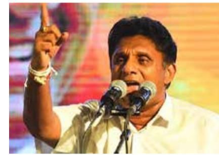
கொண்ட அரசாங்கம் இன்று அதனை மறந்து உறங்கிக் கொண்டிருக்கிறது. இதேவேளை, நாட்டின் மாணவர் சமுதாயத்தை பயங்கரவாதிகளாகவும் போதைப்

அவர் மேலும் தெரிவிக்கையில் - உயிர்த்த ஞாயிறு தாக்குதல்களை அரசியல் இலாபத்திற்காக மட்டும் பயன்படுத்திக்