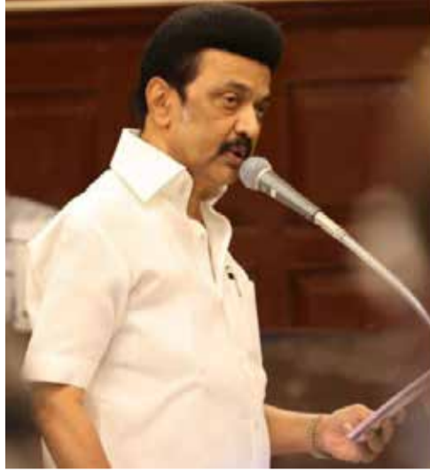
செல்வாக்கு மிக்க தலைவர்கள் இருந்தனர். அப்போது இந்த இரண்டு கட்சிகளுமே

புதுச்சேரியின் சட்டமன்ற வரலாறு 1963ல் தொடங்கியது. அப்போது இந்திய விடுதலைக்காகப் பாடுபட்ட காங்கிரஸ் கட்சி மற்றும் இந்திய கம்யூனிஸ்ட் கட்சியில்