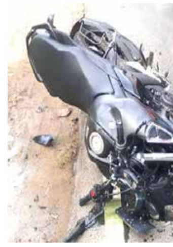
இந்நிலையில் குறுக்கே வந்த மாட்டுடன் மோட்டார் சைக்கிள் மோதியதாகவும் இதனை அடுத்து

மோட்டார் சைக்கிளில் பயணித்த இரு இளைஞர்கள்தொலைபேசியில் செல்பி எடுப்பதற்கு முற்பட்டு மாட்டுடன் மோதி விபத்துக்குள்ளானதில் படுகாயமடைந்த நிலையில் திருகோணமலை பொது வைத்தியசாலையில் அனுமதிக்கப்பட்டுள்ளனர். இவ்விபத்து நேற்று முன்தினம் (14) மாலை இடம் பெற்றுள்ளது. வவுனியாவிலிருந்து திருகோணமலை நோக்கி மோட்டார் சைக்கிளில் சென்று கொண்டிருந்த இளைஞர்கள் இருவர் மோட்டார் சைக்கிளை செலுத்திக் கொண்டிருந்த வேளையில் கையடக்க தொலைபேசியில் செல்பி எடுப்பதற்கு முற்பட்டுள்ளனர்.