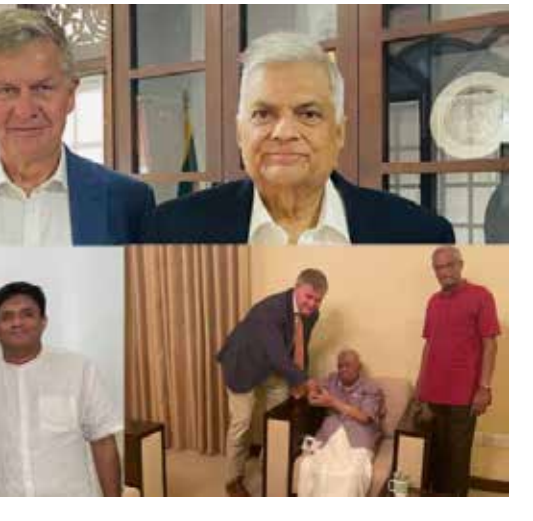
அவரது இந்தச் சந்திப்புகள் அமைந்தன என்று தெரிவிக்கப்படுகின்றது. (அ)

பாராளுமன்ற உறுப்பினர் எம்.ஏ.சுமந்திரன் ஆகியோரைச் சந்தித்துக் கலந்துரையாடியிருந்தார். சர்வகட்சி கலந்துரையாடலுக்கான பின்னணி ஏற்பாடுகளைத் தொடர்வது பற்றியே இந்தப் பேச்சுக்களின் போது அதிகளவு அக்கறையை எரிக் சொல்ஹெய்ம் வெளிப்படுத்தியுள்ளார் எனக் கூறப்படுகின்றது. மறைமுகமான மத்தியஸ்த ராகவே