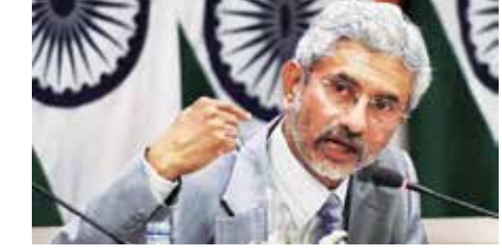
புதுடில்லி, டி.செ. 21 2014ஆம் ஆண்டு முதல் இதுவரை 2,835 இந்திய மீனவர்கள் இலங்கையில் இருந்து விடுவிக்கப்பட்டுள்ளதாக இந்திய வெளியுறவுத்துறை அமைச்சர் ஜெய்சங்கர் திங்கள்கிழமை தெரிவித்தார். பாராளுமன்ற குளிரகாலக் கூட்டத்தொடரின்போது மக்களவை

யில் பேசிய ஜெய்சங்கர் இந்தத் தகவலை தெரிவித்தார். தமிழக மீனவர்களின் விடுதலைக் காக பிரதமர் நரேந்திர மோடியை பாராட்டிய ஜெய்சங்கர், தமிழக மீனவர்களின் பிரச்சனைகள் குறித்து பிரதமர் மோடி கவனம் செலுத்தியுள்ளார். இலங்கை ஜனாதிபதி மற்றும் பிரதமருடன் பிரதமர் பலமுறை பேசியிருக்கிறார். மேலும், இலங்கையில் கைதான மீனவர்கள் விடுவிக்கப்பட்டால், அது சென்னையில் யாரோ கடிதம் எழுதுவதால் அல்ல, டில்லியில் உள்ள ஒருவர் இந்த விவகாரத்தை எடுத்துச் செல்வதால் தான்-என்றார். (அ)