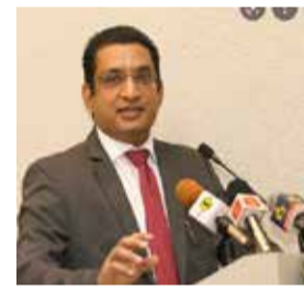
கண்ணியமாகவும், சமத்துவமாகவும் நடத்தாமல், எந்த நாடும் அல்லது சமூ

கொழும்பு, டி.செ. 23 உயர்கல்வி பெறுவது ஒவ்வொரு பெண்ணின் அடிப்படை உரிமை என வெளிவிவகார அமைச்சர் அலி சப்ரி தெரிவித்தார். அத்தகைய உரிமையை மறுப்பது மன்னிக்க முடியாதது என்றும் அமைச்சர் குறிப்பிட்டார். பெண்களுக்கு அதிகாரம் வழங்காமல், அவர்களை