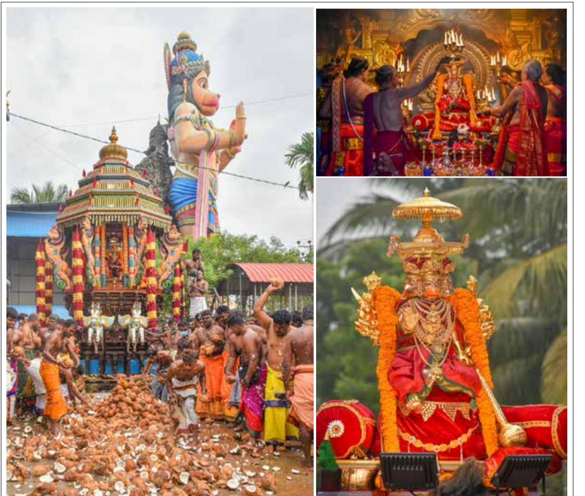
யாழ்ப்பாணம் - மருதனார்மடம் ஸ்ரீ சுந்தர ஆஞ்சநேயர் ஆலய இர தோற்சவ பெருவிழா நேற்று விழாபுக்கிழமை மிகவும் பக்தி பூர்வமாக இடம்பெற்றது.

தொடர்ந்து மாலை 5 மணியளவில் சண்நாடகக் குழுவின் தயாரிப்பில், ப. கணேசராசாவின் நெறியாள்கையில் 'காதலுக்கு மருந்து', 'தலையெழுத்து' ஆகிய நகைச்சுவை நாடகங்கள் அரங்கேற்றப்படவுள்ளன. (ஐ)