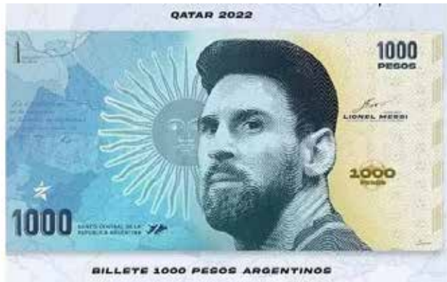
உற்சாகத்தில் ஆர்ஜென்ரினா உள்ளது. இதற்கு முன்னர் அந்த அணி 1978இல்

புனோஸ் அரெஸ், டி.செ. 23 36 ஆண்டுகளுக்கு பிறகு உலகக்கிண்ண உதைபந்து தொடரில் கிண்ணத்தை வென்ற ஆர்ஜென்ரினா அணித் தலைவர் மெஸ்ஸியின் புகைப்படத்தை, அந்நாட்டு நாணயத்தாளில் (ஆர்ஜென்ரின் பெசோ) வெளியிட ஆலோசனை நடப்பதாக தகவல் வெளியாகி உள்ளது. ஆர்ஜென்டினாவின் நாணயமானது, 'ஆர்ஜென்ரின் பெசோ' என அழைக்கப்படுகிறது. உலகக்கிண்ண கார்பந்து தொடரில் 36 ஆண்டுகளுக்கு பின் சம்பியன் கிண்ணம் வென்ற