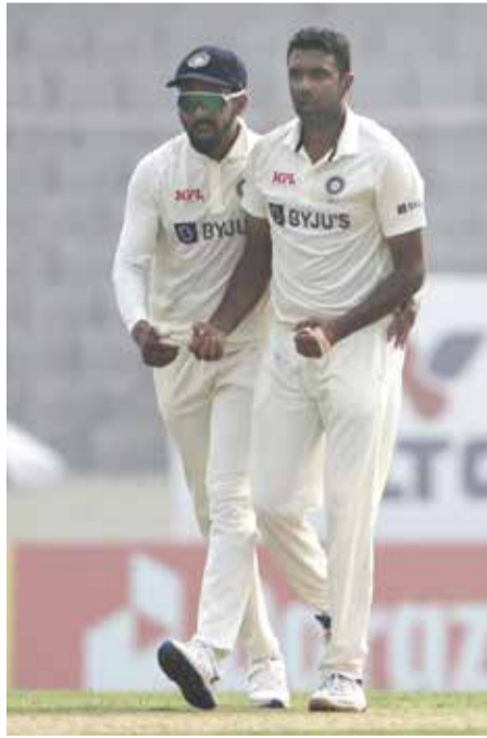
ஓட்டங்கள் எடுத்தது. பல வருடங்களுக்கு பிறகு தனது இரண்டாவது டெஸ்டை விளையாடும்

பங்களாதேஷ் அணி முதல் நாள் உணவு இடைவேளையின்போது 28 ஓவர்களில் 2 விக்கெட்கள் இழப்புக்கு 82