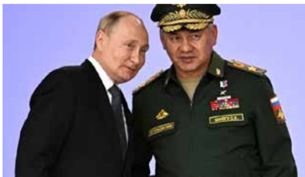
பேர்ட்யாஸ்க் மற்றும் மரிப்போல் துறைமுகங்கள் முழுமையாக செயல்படுகின்றன.

மொஸ்கோ, டி.செ. 23 உக்ரைனுடனான யுத்தத்தின் போது கைப்பற்றிய தெற்கு உக்ரைனில் உள்ள இரண்டு துறைமுக நகரங்களில் தனது கடற்படைக்கு ஆதரவாக தளங்களை நிறுவ ரஷ்யா திட்டமிட்டுள்ளது என்று பாதுகாப்பு அமைச்சர் செர்ஜி ஷோய்கு தெரிவித்தார்.