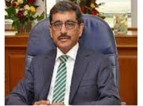
வில்லை - இருதரப்பு பேச்சுகள் நீடிப்பதே இதற்குக் காரணம்.

இலங்கை சர்வதேச நாணயநிதியத்தின் நிவாரணத்தை இந்த வருட இறுதிக்குள் பெறுவதற்கான முயற்சிகளை மேற்கொண்ட போதிலும் அது சாத்தியமாக