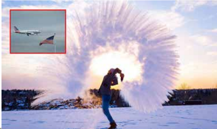
அமெரிக்காவில் கொதிக்கும் நீரை உயரே வீசி பனிக்கட்டி ஆக்கும் சவாலில் வெற்றி பெறும் வகையிலான கடுங்குளிரால் 20 கோடி பேருக்கு எச்சரிக்கை விடப்பட்டு உள்ளது.

வொஷிங்டன், டிச. 24 அமெரிக்காவில் கிறிஸ்மஸ் கொண்டாட்டங்களுக்கு மக்கள் தயாராகி வந்த சூழலில், கடும் குளிர் அதற்கு எதிராக திரும்பியுள்ளது. திடீரென உருவான வெடிகுண்டு சூறாவளி எனப்படும் குளிக்கால புயலால் நேற்று 15 லட்சம் பேருக்கு மின்சாரம் துண்டிக்கப்பட்டு அவர்கள் இருளில் மூழ்கி கிடந்தனர்.