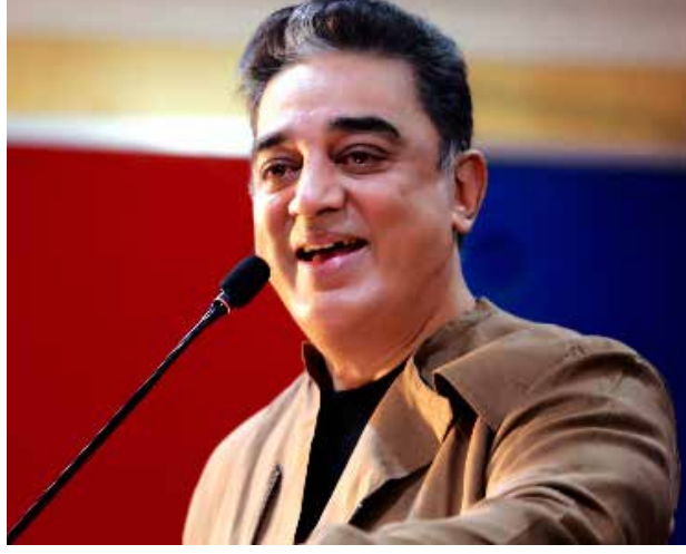
கலந்து கொண்டார். ராகுல் அழைப்பின் பேரில் கமல் கலந்து கொண்டாலும் இது அரசியல் கூட்டணிக்கான அச்சாரமாகவே கருதப்படுகிறது. ஏனெனில் பா.ஜனதாவுக்கு எதிராக வலிமையான

இந்த நிலையில் தனது கட்சியை சேர்ந்த 250 பேருடன் இன்று டெல்லியில் ராகுல் நடைபயணத்தில்