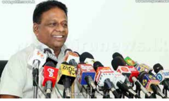
குடும்பத்தை மையமாக கொண்ட தேர்தல் முறை மைய முடிவுக்கு கொண்டு வருவதற்காக எதிர்வரும்