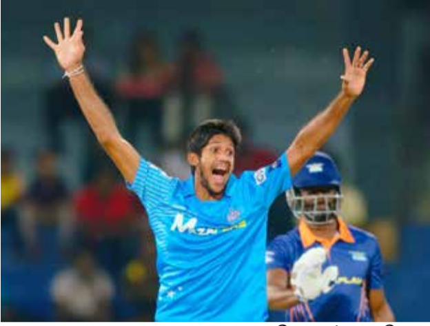
கொழும்பு, டி.செ. 24

கண்டி பல்கன்ஸ் அணிக்கு எதிராக கொழும்பு ஆர். பிரேமதாஸ் விளையாட்டரங்கில் நேற்று முன்தினம் இரவு நடைபெற்ற இறுதிப் போட்டிக்கான இரண்டாவது தகுதிப் போட்டியில் 6 விக்கெட்களால் வெற்றி பெற்ற கொழும்பு ஸ்ரார்ஸ் இறுதிப் போட்டிக்கு முன்னேறியது.