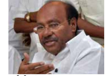
கூறியிருப்பதாவது: வங்கக் கடலில் கோடிய கரை அருகில் மீன் பிடித்த 12 மீனவர்களை இலங்கை கடற்

சென்னை, டி.செ. 24 இலங்கை கடற்படையினரால் தமிழக மீனவர்கள் கைது செய்யப்படும் பிரச்சனைக்கு தீர்வுகாணும் வகையில் இரு தரப்பு மீனவர்களிடையே பேச்சு நடத்த மத்திய, மாநில அரசுகள் ஏற்பாடு செய்ய வேண்டும் என்று பா. ம. க. நிறுவனர் ராமதாஸ் வலியுறுத்தியுள்ளார். இதுதொடர்பாக அவர் நேற்றுதனது ருவிற்றர் பதிலில்