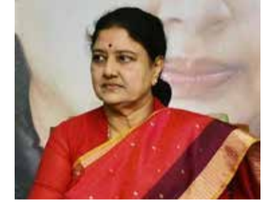
கல் கிடையாது. தி. மு. க. கொடுத்த வாக்குறுதிகளை செய்ய வேண்டும். விளம்பரம் செய்வது மட்டுமே ஆட்சி இல்லை. மக்களுக்கு செய்ய வேண்டியதை செய்ய வேண்டும். இல்லை என்றால் மக்கள் முடிவு செய்வார்கள். அதிமுகவில் அனைவரையும் ஒன்றிணைக்கும் பணியை தொடங்கி விட்டேன்.", என்றார். (ஐ)

அளிக்க முடிவு செய்து, ஆணையம் கேட்ட அனைத்து கேள்விகளுக்கும் பதில் அளித்தேன். நாங்கள் ஜெயலலிதாவை வெளிநாட்டுக்கு அழைத்துச் செல்ல வேண்டும் என்றுதான் ஆசைப்பட்டோம். ஆனால், ஜெயலலிதாதான் இங்கு சிகிச்சை நன்றாக உள்ளது. வெளிநாடு வேண்டாம் என்று தெரிவித்தார். சிகிச்சைக்காக வெளிநாடு செல்ல விருப்பமில்லை என மருத்துவர்களிடம் கூறியதே ஜெயலலிதாதான். ஒருவரை எதிர்க்க வேண்டும் என்றால் நேருக்கு நேர் நின்று எதிர்க்க வேண்டும். முதுகுக்கு பின்னாடி பேசுபவர்கள் நாங்