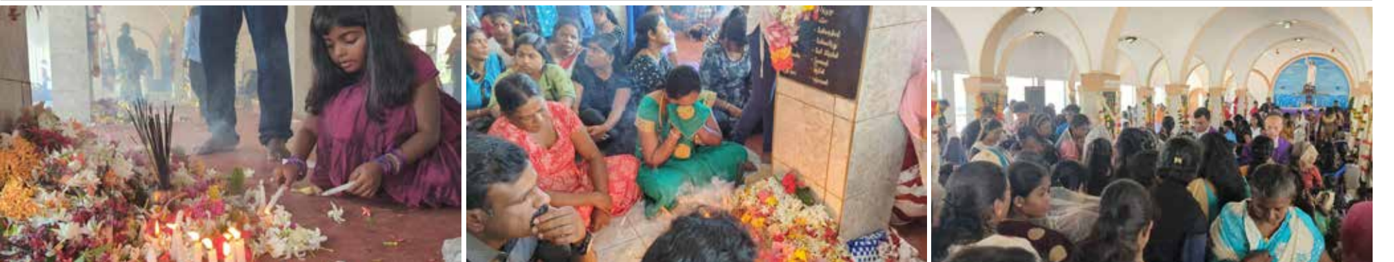
ஆழிப் பேரவையால் கொல்லப்பட்டவர்கள் நேற்று முல்லைத்தீவு சனாமி நினைவாலயத்தில் நினைவுகூரப்பட்டபோது...!

இப்பத்திரிகை 707, ஆஸ்பத்திரி வீதி, யாழ்ப்பாணம் என்ற முகவரியில் அமைந்துள்ள ஈழநாடு பிறைவேற்ற லிமிட்டெட் நிறுவனத்தினரால் 27.12.2022 அன்று 99 வீதி, நாவற்குழியில் உள்ள ஈழநாடு பிறைவேற்ற லிமிட்டெட் அச்சகத்தில் அச்சிட்டு வெளியிடப்பட்டது.