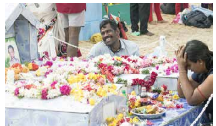
ஆழிப்பேரலையில் பிள்ளைகளை பறிகொடுத்த தந்தை ஒருவரும் தாய் ஒருவரும் கதறி அழும் காட்சி...! இடம் : உடுத்துறை சனாமி நினைவாலயம்

அரசு மருத்துவர்கள் எச்சரிக்கை கொழும்பு, டி.செ. 27 சீனா உள்ளிட்ட சில நாடுகளில் கோவிட் அச்சுறுத்தல் மீண்டும் அதிகரித்துள்ளமை இலங்கை உட்பட ஏனைய நாடுகளையும் தாக்கக்கூடும். எனவே, தொற்றா நோய்களால் பாதிக்கப்பட்டு ஆபத்தான நிலைமையில் உள்ளவர்கள் மிகுந்த அவதானத்துடன் செயல்பட வேண்டும். - இவ்வாறு அரசு மருத்துவ அதிகாரிகள் சங்கத்தின் மத்திய குழு மற்றும்