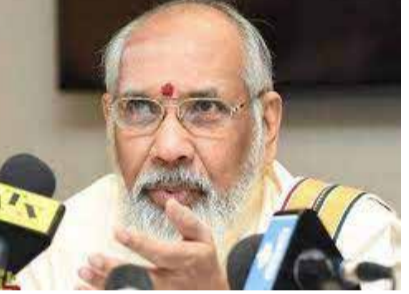
ளின் தீர்க்கப்படாதுள்ள பல பிரச்சினைகளுக்கு தீர்வை பெற்றுக்கொடுக்கும் விடயத்தில் தமிழ் தேசிய கட்சிகளிடம் ஒருமித்த கொள்கை நிலவுவதால் இணைந்து பயணிப்பது சாத்தியமான விடயம் என அவர் குறிப்பிட்டார். (அ)

அந்த தீர்மானங்கள் கூட்டணியின் அனைத்து உறுப்பினர் களுக்கும் மின்னஞ்சல் மூலம் அனுப்பி வைக்கப்படும். அதற்கு ஏதேனும் ஆட்சேபனை தெரிவிக்கப்பட்டால், அந்த விடயம் குறித்து மறுபரிசீலனையும் செய்யப்படும் நடைமுறை பின்பற்றப்பட்டு வருகின்றது. நீண்ட நாட்களாக கூட்டணியின் கலந்துரையாடல்களில் அனந்தி சசிதரன் பங்கேற்பவில்லை. இதேவேளை, தமிழ் மக்க