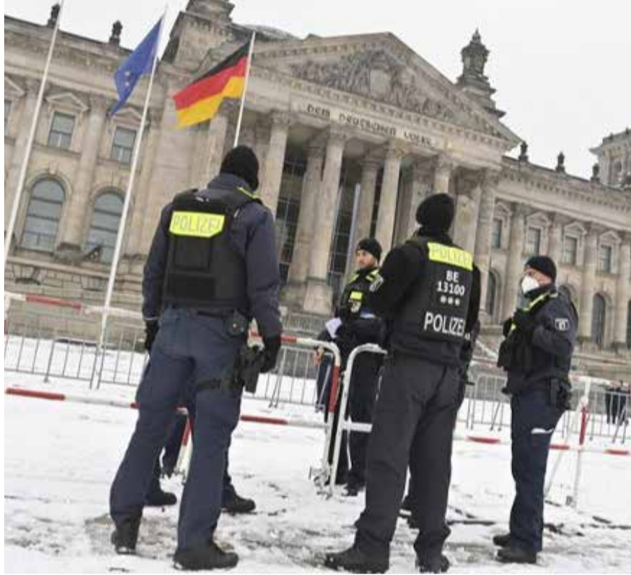
நிறுவப்பட்ட இந்த அமைப்பைச் சேர்ந்தவர்கள், ஜேர்மனியில் தற்போதுள்ள அரசு அமைப்பைக் கவிழ்த்து அதன் சொந்த அரசாங்கத்தை நிறுவ வை நோக்கமாகக் கொண்டிருந்தனர். மேலும் இராணுவ வழிமுறைகளைப்

பாடன்-வூர்ட்டெம்பேர்க்கில் உள்ள கால்வ நகரிலுள்ள கேஸ்கே இன் முகாமும் அடங்கும். இது ஏற்கனவே வலதுசாரி பயங்கரவாத ஹன்னிபால் வலையமைப்பின் மையமாக இருந்தது.