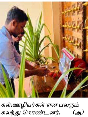
கள், ஊழியர்கள் என பலரும் கலந்து கொண்டனர். (அ)

யாழ்ப்பாணம், டி.செ. 27 ஆழிப்பேரலையின் 18ஆவது ஆண்டு நினைவேந்தல் யாழ் பல்கலைக்கழகத்தின் கைலா சபதி கலையரங்கு முன்றலில் இன்றைய தினம் உணர்வுபூர்வமாக முன்னெடுக்கப்பட்டது. சுனாமி பேரலையில் உயிர் நீத்த உறவுகளின் நினைவுருவ படத்திற்கு அகவணக்கம் செலுத்தி ஈகைசுடரேற்றப்பட்டு மலரஞ்சலியும் செலுத்தப்பட்டது. இதன் பொழுது யாழ். பல்கலைக்கழக மாணவர்