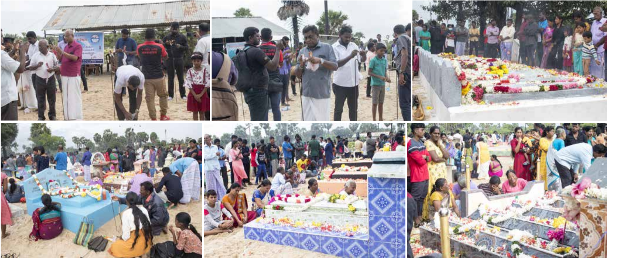
2004 டிசம்பர் 26 ஆழிப்பேரவை அனர்த்தத்தில் கொல்லப்பட்டவர்களின் 18ஆவது ஆண்டு நினைவேந்தல் நேற்று வடமராட்சி கிழக்கு - உடுத்துறை சனாமி பொது நினைவாலயத்தில் நடைபெற்றவேளை...!