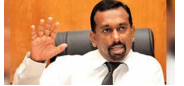
தேர்தல் ஆணைக்குழு அறிவித்திருந்தமை குறிப்பிடத்தக்கது. (அ)

இதற்கிடையில், தேர்தல் திகதியை ஜனவரி 5ஆம் திகதிக்கு முன்னதாக அறிவிப்போம் என