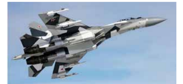
மொஸ்கோ, டி.செ. 27

ஈரானுக்கு 24 சுஹோய் எஸ்.யு.-35 போர் விமானங்களை "மிக விரைவில்" ரஷ்யா வழங்கும் என்று இஸ்ரேலிய தொலைக்காட்சி தெரிவித்துள்ளது.