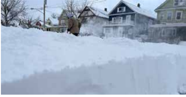
நியூயோர்க், டி.செ. 27

அமெரிக்கா மற்றும் கனடாவைத் தொடர்ந்து தாக்கும் கடுமையான உறைபனி காரணமாக குறைந்தபட்சம் 38 பேர் உயிரிழந்துள்ளதாக தெரிவிக்கப்படுகின்றது. நியூயோர்க் மாநிலத்தில் உள்ள பப்பலோ நகரம் மிக மோசமாக பாதிக்கப்பட்டுள்ள அதேவேளை அமெ