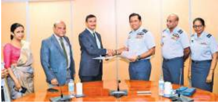
டனர் . இதனடிப்படையில் இங்கு முக்கியக் திடீர் விபத்துகள் மற்றும் அனர்த்தங்களுக்குள்ளாகி அதன் காரணமாக மூளைச்சாவு அடைந்தவர்களின் பாதுகாவுகால்களின் வேண்டுகோளின் பிரகாரம் அவர்களின் முக்கிய உடலுறுப்புகளை பெறுவதற்காக விமானம் மூலம் பாதுகாப்புக் கொண்டு செல்லப்படுவர். சுகாதார அமைச்சின் வேண்டுகோளுக்கு இணங்க கைச்சாத்திப்பட்ட இந்த ஒப்பந்தத்தின்படி, இலங்கை விமானப்படைக்கு சொந்தமான சி 130, அண்ட்னோ 32, என்60, வை