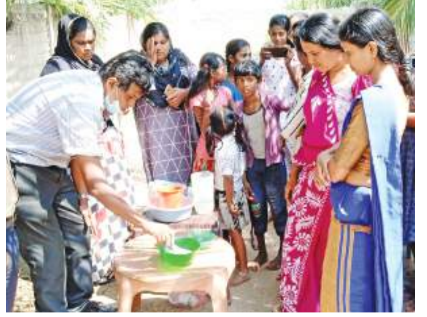
உட்பு ஸ்ரீ கிருஷ்ணா இளைஞர் கழகத்தின் வேண்டுகோளுக்கிணங்க சவர்க்காரம் செய்யும் கைத்தொழில் பயிற்சி ஒன்று உட்பு 6ம் வட்டாரத்தில் வெள்ளிக்கிழமை (23) இடம்பெற்றது. முந்தல் பிரதேச செயலகத்தின் ஊடாக இந்த வேலைத்திட்டம் இடம்பெற்றது. இதில் பணிகள் சிலர் கலந்துகொண்டு பயனடைந்தனர்.

எந்த தகவலும் கிடைக்கவில்லையெனவும் சிறுவனின் தாய் தெரிவித்தார். சிறுவனை கடத்திச் சென்ற நபரின் புகைப்படம் கிடைத்துள்ளதுடன் அந்நபர் பற்றிய தகவல் கிடைத்தால் 025,2249122 இலக்க தொலைபேசி ஊடாக எப்பாவல பொலிஸ் நிலையத்திற்கு அல்லது அருகிலுள்ள பொலிஸ் நிலையத்திற்கு அறிவிக்கும்படி பொலிசார் பொதுமக்களிடம் வேண்டுகோள் விடுத்துள்ளனர்.