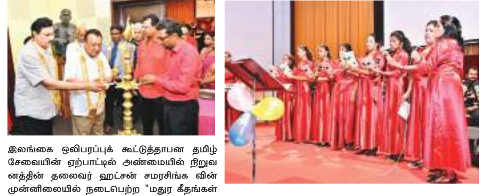
இலங்கை ஒலிபரப்புக் கூட்டுத்தாபன தமிழ் சேவையின் ஏற்பாட்டில் அண்மையில் நிறுவனத்தின் தலைவர் ஹட்சன் சமரசிங்க வின் முன்னிலையில் நடைபெற்ற "மதுர கீதங்கள் இசை நிகழ்ச்சியில் எடுக்கப்பட்ட படங்கள். நிலையத்தின் தலைவர் மற்றும் ஆலோசனை சபை உறுப்பினர் புரவலர் ஹாசிம் உமர் ஆகியோர் இணைந்து மங்கள விளக்கு ஏற்றுமையையும் ஏனைய நிகழ்வுகளையும் படங்களில் காணலாம்.