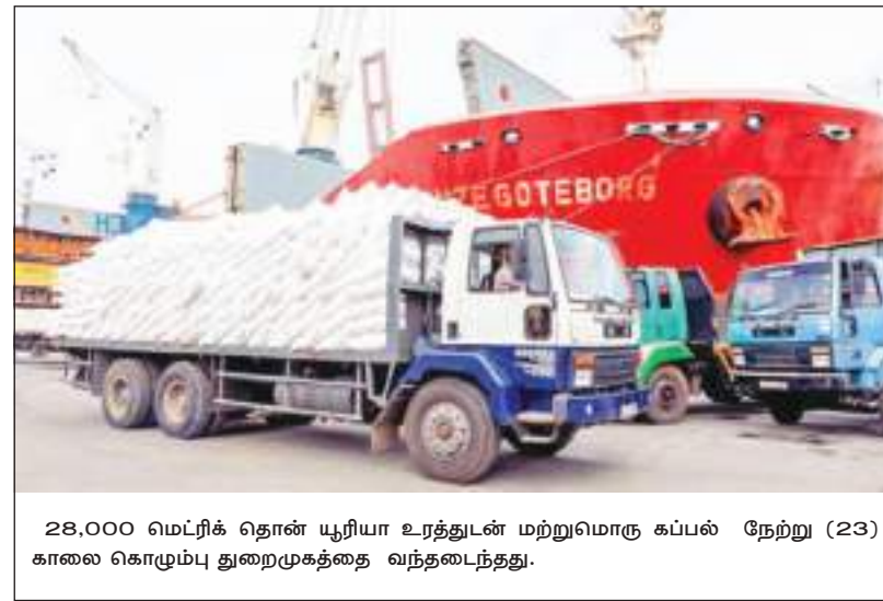
28,000 மெட்ரிக் தொன் யூரியா உரத்துடன் மற்றும் மொரு கப்பல் நேற்று (23) காலை கொழும்பு துறைமுகத்தை வந்தடைந்தது.