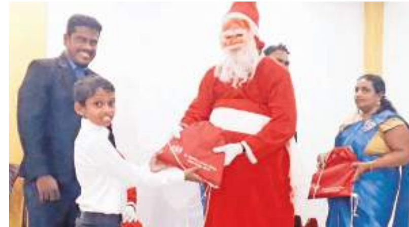
ஒலுவில் கிழக்கு தினகரன் நிருபர்

நத்தார பண்டிகையை முன்னிட்டு தம்பட்டை அறுவடை பணி திருச்சபையின் ஏற்பாட்டில் திருக்கோவில், ஆலையடிவேம்பு பிரதேச செயலகப் பிரிவுகளில் தெரிவு செய்யப்பட்ட மாணவர்களுக்கு கற்பல் உபகரணங்கள் நேற்று (23) வழங்கி வைக்கப்பட்டன.