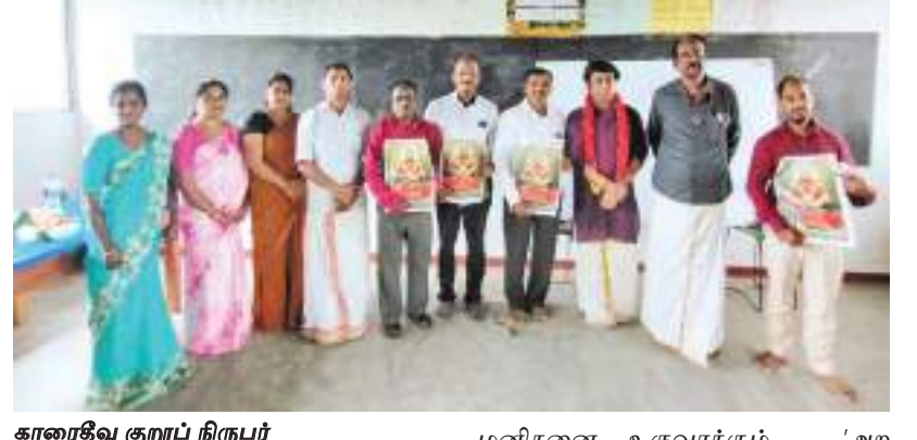
காரைதீவு குறும்பு நிருபர்