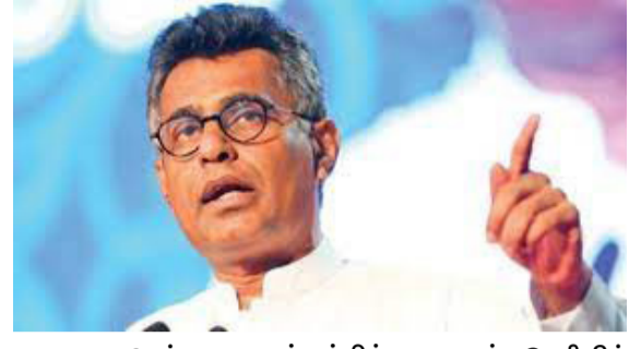
தயாராக உள்ளதாகவும் சம்பிக்க ரணவக்க தெரிவித்துள்ளார்.

இருப்பினும் தமது கொள்கைகளுடன் உடன்படக் கூடியவர்களுடன் மட்டுமே கூட்டணி அமைக்கத்