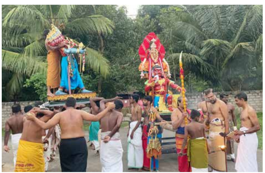
நல்லூர் வடக்கு ஸ்ரீ சந்திரசேகரப் பிள்ளையார் ஆலயத்தில் நேற்று இடம் பெற்ற கஜமுக குர சம்ஹாரத்தின் போது....

கொழும்பு, டி.செ. 28 மின்சாரக் கட்டணத்தை 60 - 65 சதவீதம் அதிகரிக்க வேண்டும் என்று இலங்கை மின்சார சபையின் பொது முகாமையாளர் றொஹான் செனவிரத்ன தெரிவித்தார். மின்சக்தி மற்றும் வலுச்சக்தி அமைச்சின் வளாகத்தில் நேற்று அவர் நடத்திய செய்தியாளர் சந்திப்பிலேயே இதனைத் தெரிவித்தார். மின்சாரக் கட்டண உயர்வுக்கு பயன்படுத்தப்பட்ட 20 அனுமானங்களில் இருந்து தெரிவு செய்யப் 12