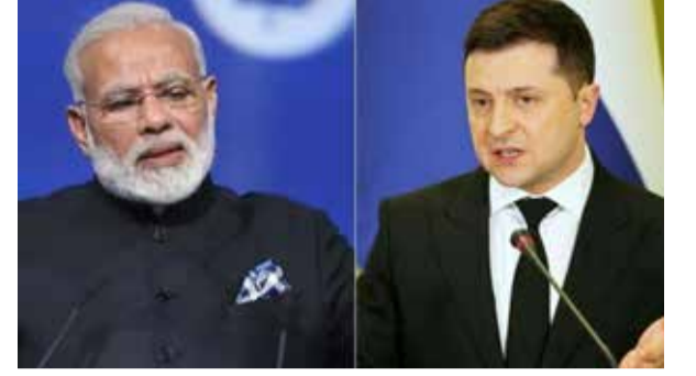
மத்தியஸ்தம் செய்வதற்கான கோரிக்கை குறித்து இந்திய அரசாங்கம் உடனடியாக கருத்து தெரிவிக்கவில்லை, ஆனால் இரு தலைவர்களும் ஒத்துழைப்பை வலுப்படுத்துவதற்கான வாய்ப்புகள் குறித்து விவாதித்ததாக அறிக்கையில் தெரிவிக்கப்பட்டுள்ளது.

உக்ரைனுடன் இணைந்திருக்கும் மேற்கத்திய நாடுகளின் அழுத்தம் இருந்தபோதிலும், இந்தியா நடுநிலையான நிலைப்பாட்டை கடைப்பிடித்து வருகின்றது. சீனாவுக்கு அடுத்த படியாக ரஷ்யாவின் எண்ணெய் இறக்குமதி செய்யும் நாடுகளில் இந்தியா இரண்டாவது இடத்தில் உள்ளது.