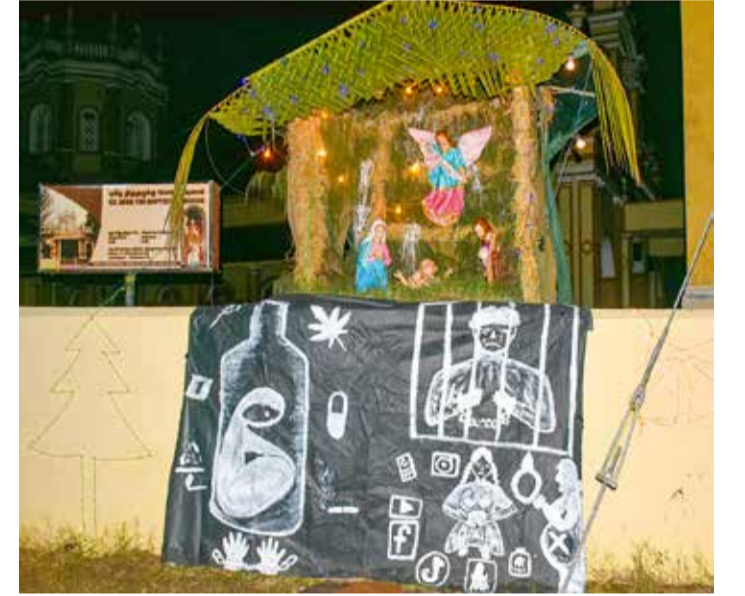
இயேசு பாலனின் பிறப்பை கொண்டாடும்முகமாக சமூக விழிப்புணர்வை ஏற்படுத்தும்விதமாக யாழ். நகர புனித திருமுழுக்கு யோவான் ஆலயத்தில் அமைக்கப்பட்ட பாலன் குடில்...!

அத்துடன், நாட்டில் தங்கியிருந்த 505 வெளிநாட்டவர்களிடம் விசாரணை நடத்தப்பட்டு அவர்களில் 130 பேர் நாட்டிலிருந்து நாடு கடத்தப்பட்டனர் என்றும் அந்தத் திணைக்களம் மேலும் குறிப்பிட்டுள்ளது. (ஐ)