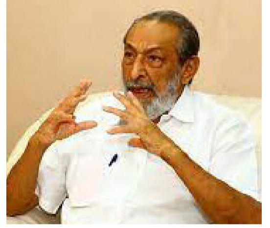
வரி வீதத்தை அதிகரித்து பொருளாதாரநீதியில் பாதிக்கப்பட்ட மக்களை மேலும் நெருக்கடிக்குள்ளாக்கியுள்ளார். சர்வதேச நாணய நிதியத்தின் ஒத்துழைப்பு கிடைப்பது நிச்சயமற்றது. - என்றார்.

உத்தியோகபூர்வமாக அறிவிப்பு எதிர்வரும் மாதம் முதல் வாரத்தில் அறிவிக்கப்படும். எதிர்க்கட்சிகளுடன் ஆரம்பக்கட்ட பேச்சுகளை முன்னெடுத்துள்ளோம். வடக்கு மற்றும் கிழக்கு மாகாணங்களை முன்னிலைப்படுத்தி அரசியல் நடவடிக்கைகளை முன்னெடுக்க தீர்மானித்துள்ளோம். தமிழ் பேசும் மக்களின் அரசியல் பிரதிநிதிகளுடன் பேச்சில் ஈடுபடத் தீர்மானித்துள்ளோம். பரந்துபட்ட அரசியல் கூட்டணியை நிச்சயம் ஸ்தாபிப்போம். ஜனாதிபதி ரணில் விக்கிரமசிங்க பதவியேற்று 5 மாதங்கள் நிறைவடைந்துள்ள நிலையில் அவர் எந்த பிரச்சினைகளுக்குத் தீர்வு கண்டுள்ளார்.