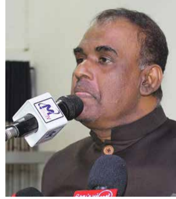
1987 ஆம் ஆண்டு காலப்பகுதியில் அரசியலிலும், கல்வித்துறையிலும் பின்தங்கிய நிலையில் முஸ்லிம் சமூகம் இருந்தபோது கிழக்கை வடக்குடன் இணைத்ததன் விளைவு, சொத்துழிவுகள், உயிரழிவுகள், இடம்பெயர்வுகள், வடக்கிலிருந்து முஸ்லிம்கள் துரத்தப்பட்ட துன்பியல் வரலாறு

முஸ்லிம்களின் அபிலாஷைகளுக்கு பங்கம் விளைவிக்க கிழக்கு மக்கள் விடமாட்டார்கள். கிழக்கில் கல்விச்சமூகம் விழிப்பாக இருந்து கொண்டிருக்கிறது. கல்வி, சமூகத்தின் எதிர்காலத்தை தீர்மானிக்கும் சக்தி கொண்டது-என்றார். (அ)