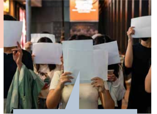
சீனாவின் கடுமையான கொரோனா கட்டுப்பாடுகளை எதிர்த்து போராட்டம், நவம்பர் 2022

பொலிவியா எல்லைக்கு அருகில் வடக்கு சிலியில் அமைந்துள்ள இகிகேவில் சட்டவிரோத குடியேற்றத்திற்கு எதிராக ஒரு குழுவினரின் போராட்டங்களுக்கு மத்தியில், அசைக்க முடியாத அமைதியின் உதாரணமாக இவர் இருக்கிறார்.