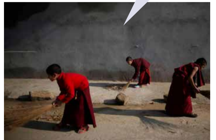
(மறு பக்கம் பார்க்க)