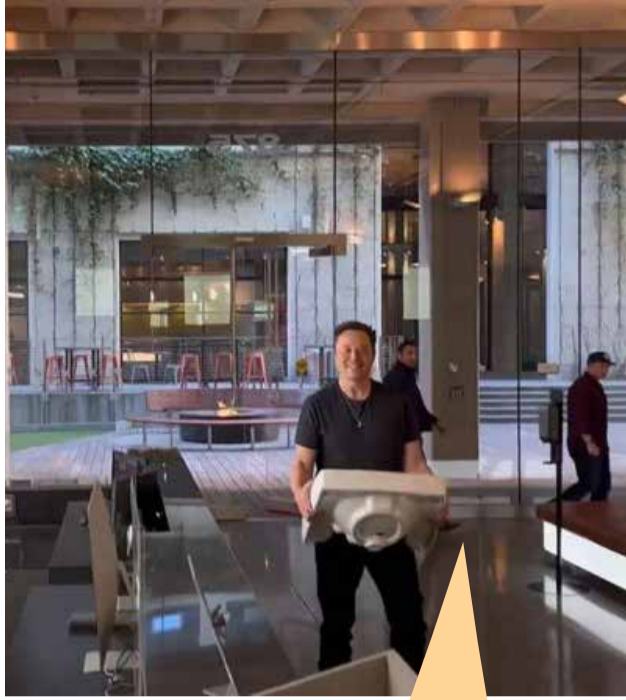
ட்விட்டர் அலுவலகத்தில் கைகழுவும் தொட்டி ஈலோன் மஸ்க், கலிஃபோர்னியா, அமெரிக்கா, அக்டோபர் 2022 உலகின் பெரும் பணக்காரர்களுள் ஒருவரான ஈலோன் மஸ்க், ட்விட்டர் அலுவலகத்திற்காக வாங்கிய புதிய கைகழுவும் தொட்டியை ஏந்திச் செல்லும் வீடியோவை பகிர்ந்திருந்தார்.