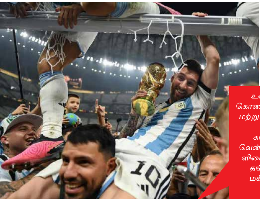
உலகக்கோப்பையை வென்றதை கொண்டாடும் லியோனெல் மெஸ்ஸி மற்றும் அர்ஜென்டினா அணியினர், சுத்தார், டிசம்பர் 2022 கால்பந்து உலகக்கோப்பையை வென்ற பின்னர் லியோனெல் மெஸ்ஸியை அர்ஜென்டினா அணியினர் தங்களின் தோள்களில் சுமந்து மகிழ்ச்சியை வெளிப்படுத்தும் புகைப்படம்.