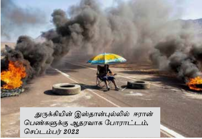
துருக்கியின் இஸ்தான்புல்லில் ஈரான் பெண்களுக்கு ஆதரவாக போராட்டம், செப்டம்பர் 2022

2022 ஆம் ஆண்டு முடிவுக்கு வர வுள்ளது. இந்தாண்டு உலகையே உலுக்கிய 14 புகைப்படங்களை தேர்ந்தெடுத்து இங்கே வழங்குகின்றோம்.