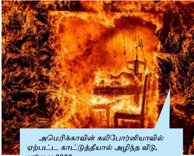
அமெரிக்காவின் கலிபோர்னியாவில் ஏற்பட்ட காட்டுத்தீயால் அழிந்த வீடு, ஜூலை 2022

சீனாவில் நடைமுறைப்படுத்தப்பட்ட கடுமையான கோவிட் கட்டுப்பாடுகளை எதிர்த்து, வெற்றுத் தாள்களை முகத்திற்கு முன் ஏந்தி போராட்டக்காரர்கள் போராட்டத்தில் ஈடுபட்டனர். ஷின்ஜியாங் மாகாணத்தில் அடுக்குமாடி குடியிருப்பு ஒன்றில் தீ விபத்து ஏற்பட்ட நிலையில், கடுமையான கட்டுப்பாடுகள் இல்லாவிட்டால் இந்த விபத்து தடுக்கப்பட்டிருக்கும் எனக் கூறி இப்போராட்டம் நடத்தப்பட்டது. தங்கள் எதிர்ப்பை பொதுவெளியில் பகிரங்கமாக வெளிப்படுத்த அனுமதிக்கப்படாததை வெளிப்படுத்தும் வகையில் வெற்றுத் தாள்கள் போராட்ட வடிவமாக பயன்படுத்தப்பட்டுள்ளன.