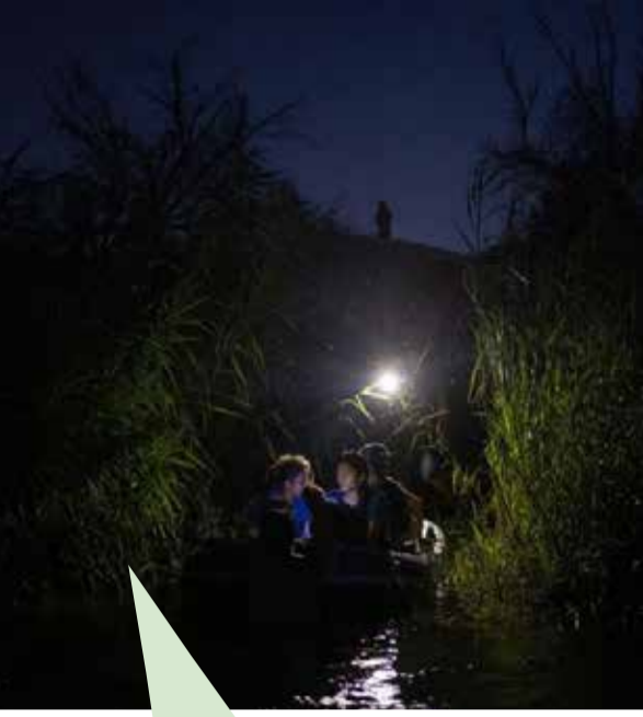
நள்ளிரவில் அமெரிக்காவுக்கு செல்லும் தஞ்சம்கோரிகள், சுடேட் மிகுல் ஆலேமான், மெக்ஸிகோ, ஜூன் 2022 மத்திய அமெரிக்காவிலிருந்து தஞ்சம் கோரிகள், நள்ளிரவில் டார்ச்சலைட் வெளிச்சத்தில் அமெரிக்காவுக்கு ஆபத்தான பயணத்தை மேற்கொண்ட புகைப்படம் இது.