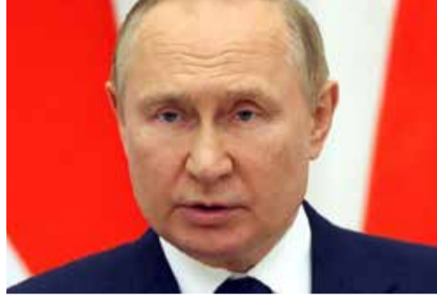
பொருட்களுக்கு ஜனாதிபதி சிறப்பு அனுமதி வழங்கலாம் என்று ஆணை குறிப்பிடுகிறது. ஜி 7 நாடுகள், ஐரோப்பிய ஒன்றியம் மற்றும் அவுஸ்திரேலியா ஆகியவை இந்த மாதம் ரஷ்யாவின் கடல்வழி மசகு எண்ணெயின் விலையை கட்டுப்படுத்த

எவ்வாறாயினும், விலை உச்ச வரம்பின் கீழ் தடை செய்யப்பட்ட