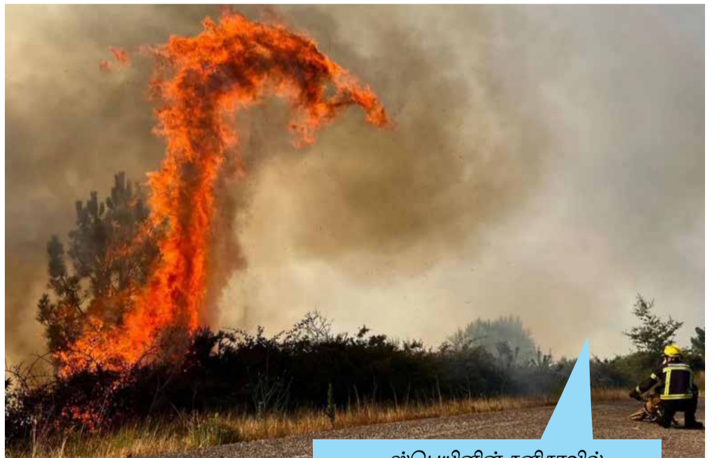
ஸ்பெயினின் கனிசாவில் ஏற்பட்ட காட்டுத்தீ, ஆகஸ்ட் 2022