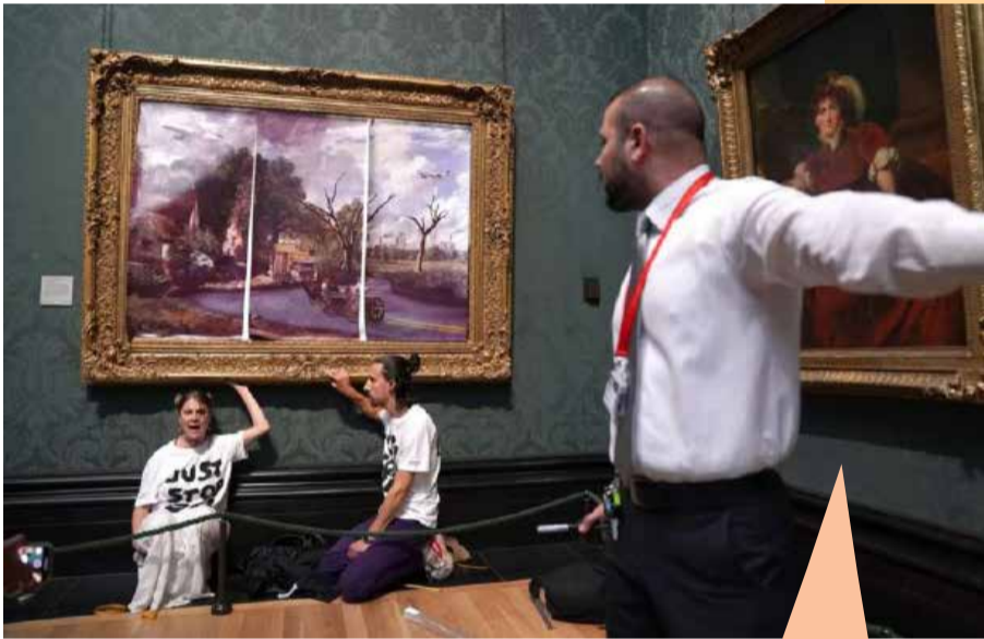
புதைபடிம எரிபொருள் பயன் பாட்டுக்கு எதிரான போராட்டத்திற்கு ஆதரவு, லண்டன், பிரிட்டன், ஜூலை 2022