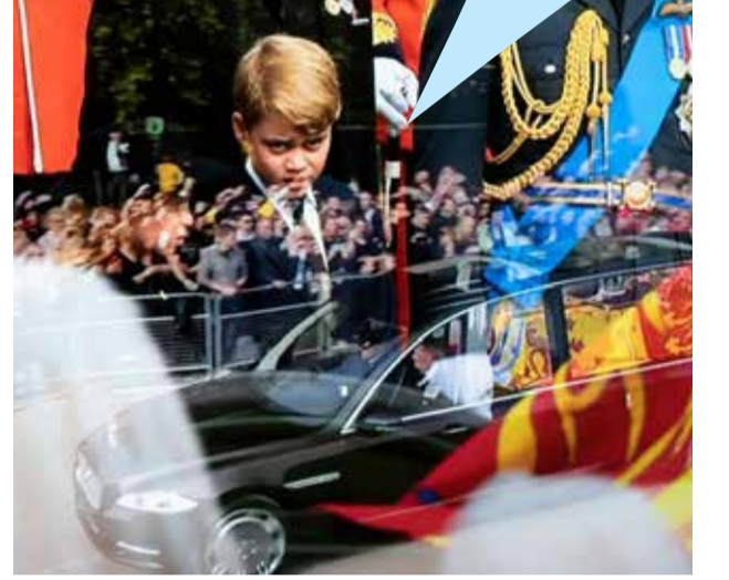
ராணி எலிசபெத்தின் இறுதி ஊர்வலத்தைப் பார்க்கும் இளவரசர் ஜார்ஜ், பிரிட்டன், செப்டம்பர் 2022 ராணி எலிசபெத் செப்டம்பர் 8 அன்று மறைந்த நிலையில், அந்த துயரத்தை வெளிப்படுத்தும் பல புகைப்படங்கள் வெளியாகின. தனது கொள்ளுப்பாட்டியான ராணி எலிசபெத்தின் இறுதி ஊர்வலத்தைப் பார்க்கும் இளவரசர் ஜார்ஜின் புகைப்படம் இது. விண்ட்சரை நோக்கி இறுதி ஊர்வலம் செல்லும்போது தொலைக்காட்சியில் ஒளிபரப்பப்பட்டதிலிருந்து எடுக்கப்பட்ட புகைப்படம் இது.