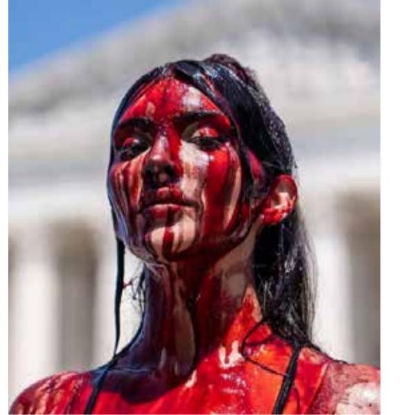
பூச்சை தன் உடலில் ஊற்றிக்கொண்டு போராடிய புகைப்படம் நம்மை உலுக்குவதாக உள்ளது.