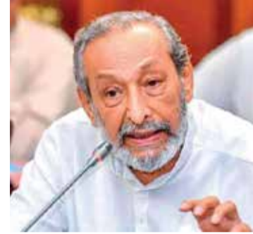
பிரதிநிதிகளின் பொறுப்பு என்றும் அவர் தெரிவித்தார். தேர்தல் விவகாரம் உயர்நீதி

அதிலும் வடக்கு, கிழக்கு மாகாணங்களை முன்னிலைப்படுத்தி அரசியல் நடவடிக்கைகளை முன்னெடுக்கவும் அதற்காக தமிழ் பேசும் மக்களின் பிரதிநிதிகளுடன் பேச்சுவார்த்தையில் ஈடுபட தீர்மானித்துள்ளதாகவும் அவர் குறிப்பிட்டார். உள்ளூராட்சிமன்றத் தேர்தலை பிற்போட அரசாங்கம் பல்வேறு வழிமுறைகளை தற்போது முன்னெடுத்துள்ள போதும் நாட்டு மக்களின் உரிமையை பாதுகாப்பது மக்கள்