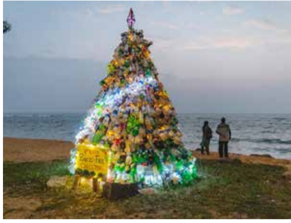
இந்த மரம் டிசம்பர் 30 வரை காட்சிப்படுத்தப்படும் என்றும் பின்னர் இந்த போத்தல்கள் ஜீரோட்ராஷ் மூலம் சேகரிக்கப்பட்டு மறுசுழற்சி செய்யப்படும் என்றும் தெரிவிக்கப்படுகிறது. (ஐ)

அதிகரித்து வரும் பிளாஸ்டிக் மாசுபாடு காரணமாக இலங்கையின் கடல் சூழல் எதிர்கொள்ளும் சவால்களை வெளிப்படுத்தும் முகமாக இந்த மரம் அமைக்கப்பட்டதாக பேர்ஸ் புரடக்டர் தெரிவித்துள்ளது.