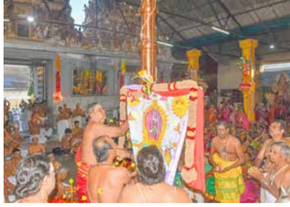
நல்லூர் சிவன் கோவில் என அழைக்கப்படும் ஸ்ரீ கமலாம்பிகா சமேத ஸ்ரீ கைலாசநாத சுவாமி ஆலய வருடாந்த திருவிழா நேற்று காலை 7 மணிக்கு கொடியேற்றத்துடன் ஆரம்பமானபோது...!