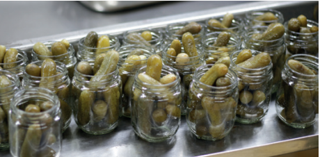
உண்பதற்குத் தயாராக பதப்படுத்தப்பட்ட வெள்ளரி, போத்தல்களில் அடைக்கப்பட்டுள்ளது.

ஆய்வு செய்யப்படுகின்றன. பிரத்தியேக தண்ணீரில் நவீன இயந்திரங்களால் சுழலப்படும் உணவு மூலப்பொருட்கள், பட்டிகள் ஊடாக வரும்போது, சிறப்புத்தேர்ச்சிபெற்ற நிபுணர்களால் தரம்பரிக்கப்படுகின்றன. தயாரிப்புகளின் போது சகல சந்தர்ப்பங்களிலும் தரத்திலும், சுகாதாரத்திலும் அக்கறையுடன் கவனம் செலுத்துவதை அவதானிக்க முடிந்தது.