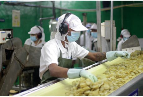
பட்டிகள் ஊடாக வரும்போது, சிறுபூத்தேர்ச்சி பெற்ற நிபுணர்களால் தரம்பரிக்கப்படுகின்றன

இவர்கள் தெரிவித்த கருத்துகள் பின்வருமாறு அமைந்திருந்தன: இங்கு, முக்கியமாக தேங்காய், பலாக்காய், முருங்கை, வெள்ளரிக்காய் உட்பட வெப்பமண்டலம் மற்றும் ஆரோக்கியம் சார்ந்த உணவுப் பொருட்கள் என்பன அவற்றின் மதிப்பும் கவையும் சத்துமும் கொடாதவாறு பதப்படுத்தப்பட்டு, பாதுகாப்பும் கவர்ச்சியும் மிக்க கொள்கலன்களில் அடைக்கப்பட்டு ஏற்றுமதி செய்யப்படுகின்றன. தென்னை சார்ந்த உணவுப்பொருட்களில் இருந்து சுமார் 18 வகையான உணவுப் பொருட்களும் பலாக்காயில் இருந்து ஏழும் முருங்கையில் இருந்து ஆறு உணவுப் பொருட்களும் வெள்ளரியில் இருந்து 15 உணவுப் பொருட்களும் வெப்பவலய உணவுப் பொருட்களாக அன்னாசி, செவ்விலிநீர் என்பனவும் இங்கு உற்பத்தி செய்யப்படுகின்றன. குறிப்பாக, செவ்விலிநீரின் கவையும் இதழும் பதமும் கொடாதவாறு, செவ்விலிநீர் மரத்தின் வடிவம் கொண்ட போத்தலில் அடைக்கப்படுகிறது. ஆரோக்கியம் தரும் உணவுப் பொருட்களாக உள்ளி கலந்த தேன், கறுவா பானம், கறுவா கலந்த தேன் என்பன தயாரிக்கப்படுகின்றன. இலங்கைக்கே உரித்தான மசாலாப் பொருட்களான கறுவா, மிளகு, வெள்ளை மிளகு ஆகியவற்றிலிருந்து நான்கு வகைப் பொருட்களும், மரக்கறிகளில் இருந்து சுமார் 19 வகை உணவுப் பொருட்களும்