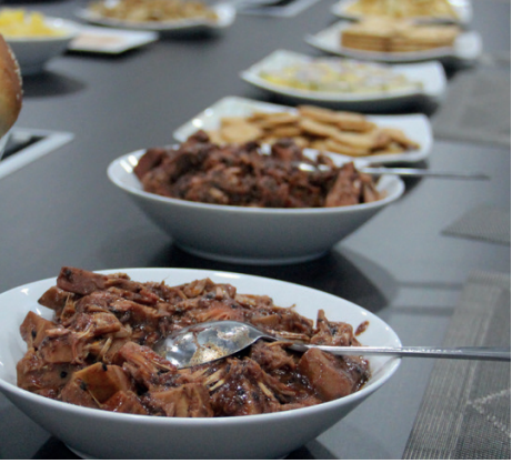
பளபிஞ்சு ‘பாபிக்கி’ கறிகள் உண்பதற்குத் தயாராக...

மட்டக்களப்பு, வாகரையில் விவசாய நல புத்தாக்கத்துக்கு ‘ஹேலிய்ஸ்’ நிறுவனம் பாரிய பங்களித்து வருகின்றது. இங்கு விவசாயிகள் பெருமளவில் வெள்ளரி செய்கையில் ஈடுபட்டு வருகின்றார்கள். விவசாயத்துறை நல புத்தாக்கத் திட்டமானது, விவசாயிகளுக்குத் தேவையான புதிய தொழில்நுட்பம், பணம், உபகரணங்கள் என்பவற்றை வழங்கி, விளைபொருட்களை விற்பனை செய்வதற்குத் தேவையான சந்தையை வழங்கி, விவசாயிகளை அதிக வருமானம் ஈட்டக்கூடியவர்களாக மாற்றுவதாகும். மேலும், வானிலை மாற்றங்களுக்கு