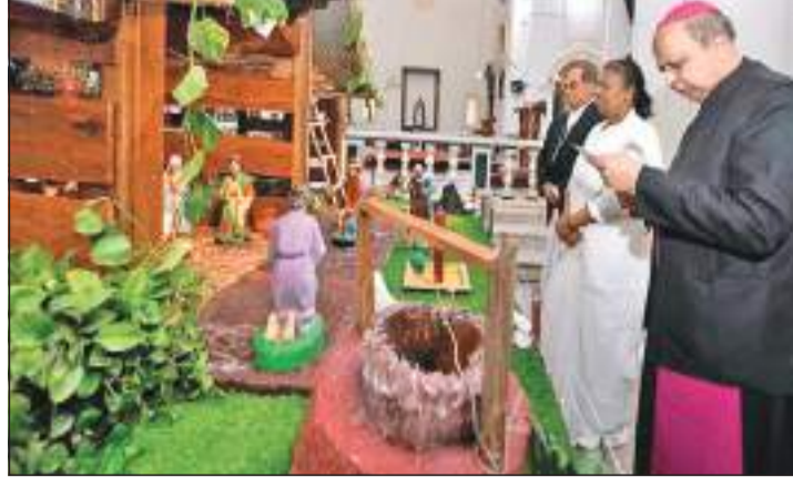
வாகும் என்றும் நீடித்த உலக என்றும் அவர் தெரிவித்துள்ளார். அமைதிக்கு அது வழிவகுக்கும்

கருணை மற்றும் தியாகத்தால் இயேசு கிறிஸ்து மக்களுக்கு விடுத்திருக்கும் செய்தியை புரிந்து கொண்டு அன்பு மற்றும் பரிவுடன் மக்கள் ஒருவரை ஒருவர் நேசிக்க வேண்டும் என இந்திய மக்களிடம் கேட்டுக் கொண்டுள்ளார்.