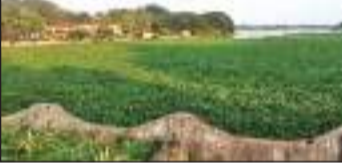
மட்டக்களப்பு விசேட நிருபர்

மட்டக்களப்பு கல்விப்பாலம், கோட்டைமுனைப்பாலம், பூம்புகார் புதிய வெள்ளைப்பாலம் ஆகியவற்றை அண்டிய வாழியில் நீர்த்தாவரங்கள் படர்ந்துள்ளதால், தமது வாழ்வாதாரத் தொழில் பாதிக்கப்பட்டுள்ளதாக, வாழித் தொழிலாளர்கள் தெரிவித்தனர்.