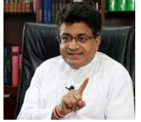
யான காலப்பகுதிக்குள் நடத்தப்பட வேண்டும்.

எதிர்வரும் மாதம் 04 ஆம் திகதி உள்ள ராட்சி மன்றத் தேர்தல் தொடர்பான அறிவிப்பு வெளியிடப்பட்டால் 2023 ஆம் ஆண்டு பெப்ரவரி மாதம் 25 ஆம் திகதி முதல் மார்ச் மாதம் 11 ஆம் திகதி வரை