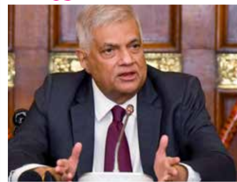
அம்பேவெல பண்ணைக்கு அருகில் கைவிடப்பட்ட 30 ஏக்கர் காணியை உடனடியாக பண்ணைக்கு வழங்குமாறு

நுவரெலியாமாவட்ட செயலாளர் மற்றும் மாநகர ஆணையாளருக்கு ஜனாதிபதி ரணில் விக்கிரமசிங்க பணிப்புரை விடுத்துள்ளார்.