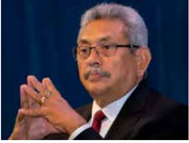
கோட்டாபய கடந்த திங்கட்கிழமை அமெரிக்கா

- இவ்வாறு ஐக்கிய தேசியக் கட்சியின் தவிசாளரும் நாடாளுமன்ற உறுப்பினருமான வஜிர அபேவர்த்தன தெரிவித்தார்.