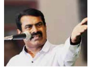
தைகள் உடல் நலம் பாதிக்கப்பட்டு மருத்துவமனையில் சிகிச்சைப் பெற்று வரும் செய்தி மிகுந்த துயரத்தை அளிக்கிறது. சிறிதும் மனச்சான்று இன்றி இத்தகைய வன்கொடுமைகளைப் புரிந்த சமூகவிரோதிகள் யாராக இருந்தாலும் அவர்களை உடனடியாக கைது செய்து சட்டத்தின் மூலம் கடும் தண்டனை பெற்றுத்தர நடவடிக்கை எடுக்க வேண்டுமெனவும் மாவட்ட ஆட்சியரைக் கேட்டுக்கொள்கிறேன் - என்றும் கூறியுள்ளார். (ஐ)

இதே போல் வேங்கை வயலில் ஆதித்தமிழ்மக்கள் பயன்படுத்திய குடிநீர்த் தேக்கத் தொட்டியில் மனித கழிவை கலந்த சமூக விரோதிகள் செயல் ஏற்றுக்கொள்ளவே முடியாத பெருங்கொடுமையாகும். அதனை பருகிய குழந்தைகள் உடல் நலம் பாதிக்கப்பட்டு மருத்துவமனையில் சிகிச்சைப் பெற்று வரும் செய்தி மிகுந்த துயரத்தை அளிக்கிறது. சிறிதும் மனச்சான்று இன்றி இத்தகைய வன்கொடுமைகளைப் புரிந்த சமூகவிரோதிகள் யாராக இருந்தாலும் அவர்களை உடனடியாக கைது செய்து சட்டத்தின் மூலம் கடும் தண்டனை பெற்றுத்தர நடவடிக்கை எடுக்க வேண்டுமெனவும் மாவட்ட ஆட்சியரைக் கேட்டுக்கொள்கிறேன் - என்றும் கூறியுள்ளார். (ஐ)