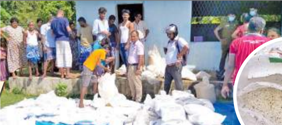
பட்ட ஆசிரியர் கிராம அலுவலர் பிரிவில் உள்ள மதுராநகர் கிராமத்தின் பொது நோக்கு மண்டபத்தில் அரிசி மூடைகள் சில இருப்பதாக கிடைத்த தகவல்களுக்கு அமைவாக மண்டபத்தை அப்பகுதி மக்கள்

வவுனியாவில் பதுக்கி வைக்கப்பட்டிருந்த இந்திய அரசாங்கத்தால் நிவாரணத்துக்காக வழங்கப்பட்ட 1,272 கிலோ அரிசி மீட்கப்பட்டுள்ளது. இவை பாவனைக்கு தவாத நிலையிலேயே மீட்கப்பட்டதாக பொலிஸார் தெரிவித்தனர். வவுனியா பிரதேச செயலக பிரிவுக்குட்பட்ட ஆசிரியர் கிராம அலுவலர் பிரிவிலுள்ள மதுராநகர் கிராம பொதுநோக்கு மண்டபத்திலிருந்து மீட்பு