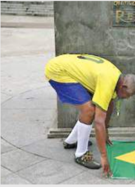
பீலேவின் மரணத்தை நினைவாக மெக்ஸிகோவில் நடைபெற்ற ரிவால்வூசியா மார்பாட்டி போட்டியில் அவர் காலமான செய்தி குறித்து நினைவுகூர்ந்து கொண்டிருக்கிறார்.

பற்றிய விபரங்களை வெளியிட்டது. வரும் திங்கட்கிழமை அவரது உடல் மருத்துவமனையில் இருந்து கழகத்தின் எல்டாடியோ அர்பானோ கல்டெரா மைதானத்திற்கு எடுத்துச் செல்லப்பட்டவுள்ளது. அங்கு மைதானத்தின் நடுவில் மக்கள் அஞ்சலிக்காக பூதவுடல் வைக்கப்படும். செவ்வாய்க்கிழமை குடும்ப இறுதிச் சடங்கிற்கு சாவோ போலோவில் உள்ள நாண்டோஸ் வீதிகள் வழியாக பூதவுடல் ஊர்வலமாக எடுத்துச் செல்லப்பட்டவுள்ளது.