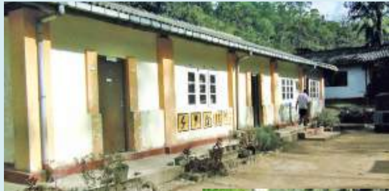
ஹற்றன் விசேட நிருபர்

அம்பகமுல பிரதேச சபைக்கு சொந்தமான கினிகத்தேனை பகது லவ பிலேக்வோட்டர் தோட்டத்திற்கு செல்லும் பாதை கடந்த 15 வருடங்களுக்கு மேலாக குண்டும் குழியுமாக காணப்படுவதாக பொது மக்கள் விசனம் தெரிவிக்கின்றனர்.