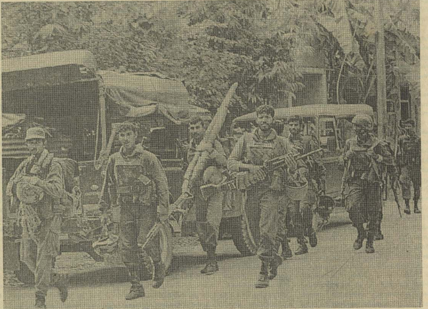
ஆய்சிக்குறு இராணுவ நடவடிக்கையில் ஈடுபட்டுள்ள இனவாத படையினர்

பொதுஜன முன்னணியைக் கொண்டு இந்நாட்டில் ஒரு பகுதியின் அதிகாரத்தை வேறு அரசியல் அமைப்பிடம் கையளிக்க ஏகாதிபத்தியவாதிகள் செயற்படுகின்றார்கள் எனக் கூறும்படித் து. ஜே.வீ.பி. உட்பட்ட ஏனைய பாசிச அமைப்புகளும் ஏகாதிபத்தியச் சார்பு இந்த அரசாங்கத்தினதும் இராணுவத்தினதும் ஆதரவின் அடிப்படையில் தாம் பொதுமக்களுக்கு எதிரான ஒடுக்குமுறை காடைத்தனங்களுக்கு தயாராகுவதை காட்டிக் கொண்டுள்ளன. பொதுஜன முன்னணி அரசாங்கத்தின் இராணுவ-பாசிச சர்வாதிகாரத்தின் திட்டங்களை அம்பலப்படுத்துவதற்கு பதிலாக அதிகாரப்