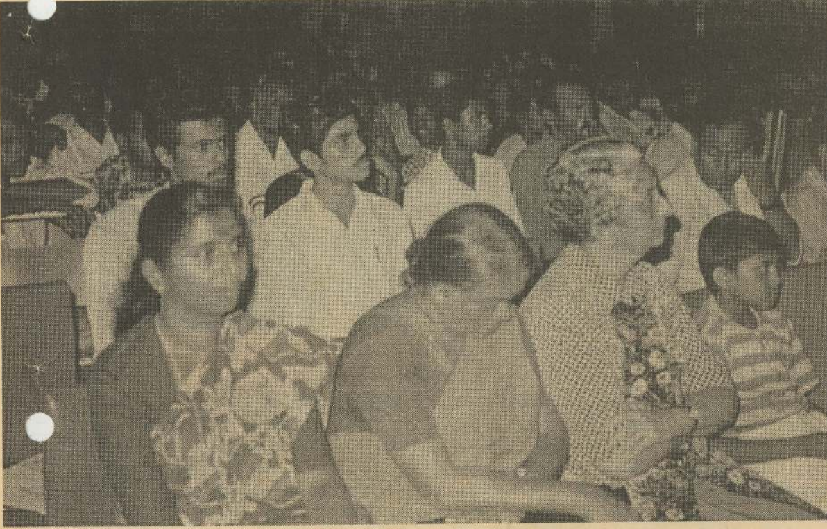
சோ.ச.க. அக்டோபர் புரட்சியின் 80வது ஆண்டு நிறைவு விழாவுக்கு வருகை தந்தவர்களில் ஒரு பகுதியினர்.

கோட்பாட்டின் அடிப்படை அம்சங்கள் முன்றினை இட்டுநிரப்பும் மாதிரியை விளக்கினோம். முதலாவது, ஏழை மக்களின் ஆதரவைப் பெற்ற தொழிலாளர் வர்க்கம் அரசு அதிகாரத்தை ஸ்தாபிதம் செய்வதன் மூலம் முதலாளித்துவ ஜனநாயகப் புரட்சியினை இட்டுநிரப்புவதுடன் நின்றுவிடாது, சோசலிச நடவடிக்கைகளுக்கான பணியில் இறங்குதல். இரண்டாவது, ஒரு நாட்டில் வெற்றி பெறும் தொழிலாளர் வர்க்கப் புரட்சி, உலக சோசலிசப் புரட்சியின் நடவடிக்கையாக விளங்குதல். ஒரு நாட்டில் தோன்றும் புரட்சி அனைத்துலக அரங்கில் பரந்து, உலக அரங்கில் மலர் தல். மூன்றாவது, தொழிலாளர் வர்க்க அரசின் கீழ் அனைத்துலக ஒத்துழைப்பின் அடிப்படையில் பழைய சமுதாயம் ஒரு தொகை தோல் உரிப்புக்களுக்கு இலக்காகி, சோசலிச சமுதாயத்தை நோக்கி இடைமருவுதல். அக்டோபர் புரட்சியினுள் இந்த விஞ்ஞானபூர்வமான தூரதிரிஷ்டி முதலில் நிறுதிக்கப்பட்டது. ட்ரொட்ஸ்கியின் நிரந்தரப் புரட்சி கோட்பாடு ஏகாதிபத்திய யுகத்தின் தொழிலாளர்-ஒடுக்கப்படும் மக்களின் விடுதலை சம்பந்தமாக எவ்வளவுக்கு பொருத்தமானது என்பதை அது வெளிப்படுத்தியது. முதலாளித்துவச் சார்பு சீர்திருத்தவாதிகளும் வர்க்க சமரசவாதிகளும் ட்ரொட்ஸ்கிக்கும் நிரந்தரப் புரட்சிக் கோட்பாட்டுக்கும் அந்தளவுக்கு வன்மம் சாதிப்பது அக்டோபர் புரட்சிக்கு காட்டும் வன்மத்தின் ஒரு பாகமாக அமைந்திருப்பது தற்செயலானது அல்ல. அவர்கள் அன்புடன் கட்டியணைப்பது சோவியத் யூனியனுள் வளர்ச்சி கண்டுவந்த வசதிவாய்ப்புக்கள் நிறைந்த அதிகாரத்துவத்தின் தேசியவாத நாற்றமெடுப்பை வெளிக்காட்டிக் கொண்ட ஜோசப் ஸ்டாலினையேயாகும்.