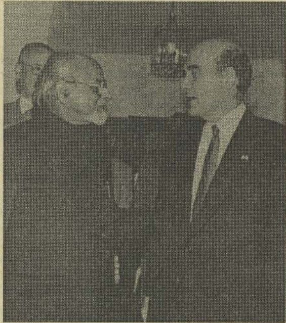
இந்திய பிரதமர் குஜராலும் அமெரிக்க வர்க்க செயலாளரும்

கடந்த ஆண்டில் 15 இலட்சம் வங்கி ஊழியர்கள் அடையாள வேலைநிறுத்தம் செய்தனர். இதற்கிடையே 80 இலட்சம் பிராந்திய அரசு ஊழியர்கள் தற்சமயம் சம்பள உயர்வு கோரி பிரச்சாரத்தில் இறங்கி உள்ளனர். கல்வி வெட்டுக்கு எதிராக ஆசிரியர்-மாணவர்களிடையே பிரச்சாரம் வெடித்துள்ளது. ஸ்டாலினிச ஆட்சி நிலவும் கேரள மாநிலத்தில் பல்லாயிரக் கணக்கான விவசாயத் தொழிலாளர்கள் ஸ்டாலினிச தலைவர்கள் தமது பிரச்சாரத்துக்கு எதிராக இருந்து கொண்டுள்ள நிலையிலும் கூட