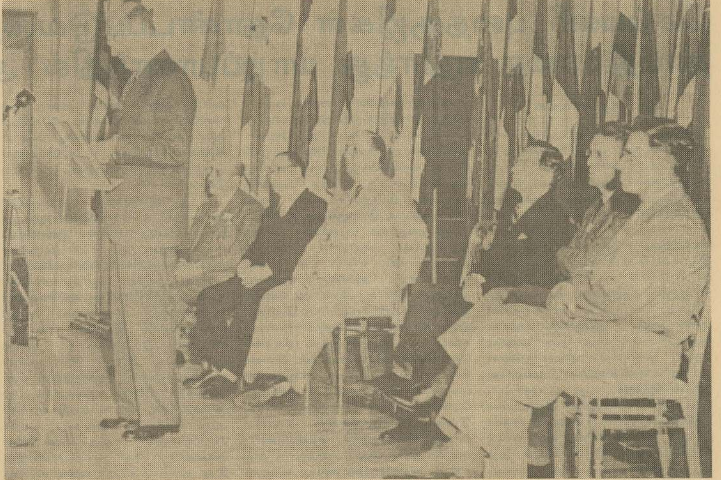
1944ல் பிரெட்டன்வூட்ஸ் மகாநாடு

பிரெட்டன்வூட்ஸ் மகாநாடு ஒரு பெரிதும் ஒழுங்கமைக்கப்பட்ட நாணய அமைப்பினை ஸ்தாபிதம் செய்தது. அமெரிக்க டாலர் அனைத்துலக நாணயமாக ஸ்தாபிதம் செய்யப்பட்டது. ஒரு அவன்ஸ் தங்கம் 35 டாலர் எனக் கொள்ளப்பட்டது. பெரும் நாணயங்களுக்கு இடையே ஒரு நிலையான நாணய வீதத்தை ஸ்தாபிதம் செய்வது இந்த அமைப்பின் அடிக்கல் லாக விளங்கியது. 1930பதுகளில் அந்தளவு பேரழிவுகளுக்கு காரணமாக இருந்த போட்டி நாணய மதிப்பிற்கக்கங்களையும் அழிவுக்கிடமான நாணய மதிப்புக்களையும் தடுக்க சர்வதேச நாணய நிதியம் (IMF) ஸ்தாபிக்கப்பட்டது. சென்மதி நிலுவை கொடுப்பனவுக் கட்டங்களுக்கு உள்ளாகும்