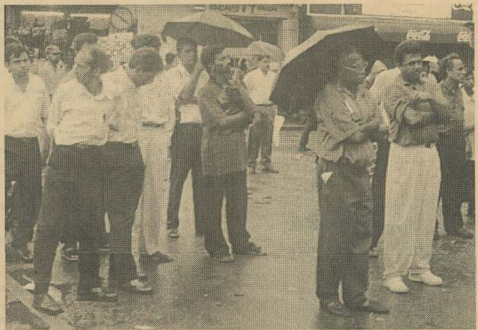
வெள்ளவத்தை சந்தைக்கு முன்னால் நடைபெற்ற பிரச்சார கூட்டப் பேச்சுக்களை கேட்போரில் ஒரு பகுதியினர்

அதன் பேரில் இலங்கையின் உள்ளும் அனைத்துலக ரீதியிலும் தொழிலாளர் வர்க்கம், ஒடுக்கப்படும் மக்கள், புத்திஜீவிகள், ஜனநாயக உரிமைகளையிட்டு அக்கறை கொண்டவர்களிடையே உலக பொதுஜன அபிப்பிராயத்தை கட்டியெழுப்பும் பிரச்சாரத்தினை சோ.ச.க.வும் நான்காம் அகிலத்தின் அனைத்துலகக் குழுவும் தொடுத்துள்ளதாக கூறிய அவர் இந்த வெள்ளவத்தைக் கூட்டம் அதன் ஒரு பாகம்