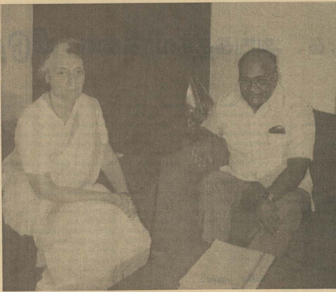
தமிழர் விடுதலைக் கூட்டணி செயலாளர் நாயகம் அ. அமிர்தலிங்கம் அன்றைய இந்திய பிரதமர் இந்திரா காந்தியுடன் பேச்சுவார்த்தையில்

சமசமாஜ, கம்யூனிஸ்ட் துரோகிகளையும் சேர்த்துக் கொண்டு இடம்பெற்ற பேச்சுவார்த்தைகளின் முதல் சுற்று; பாராளுமன்றத்தில் இருந்து வெளியே தள்ளப்பட்டு இருந்த தமிழர் விடுதலைக் கூட்டணியை வட்டமேசைக்கு இழுப்பதாக விளங்கியது. இரண்டாவது சுற்று, சகல முதலாளித்துவக் கட்சிகளையும் ஆதரவுடன் வடக்கில் சிளர்ந்து எழுந்த மக்களுக்கும்