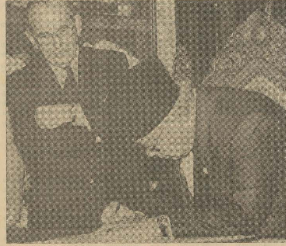
இந்தோனேஷிய மாஜி. சர்வாதிகாரி சுகார்டோ சர்வதேச நாணய நிதிய முகாமைப் பணிப்பாளர் கட்டுசஸ் பார்த்துக் கொண்டு சின் நேரடி பார்வையில் 'உதவி' உடன்படிக்கையில்

ஸ்பார்ட்டிஸ்டுகள் அனைத்துலகக் குழுவின் மீதான தமது தாக்குதலின் போது லெனினையும் அவரின் ஏகாதிபத்தியம் பற்றிய ஆக்கங்களையும் தொடர்ந்து இழுக்கின்றது. ஆனால் லெனினின்