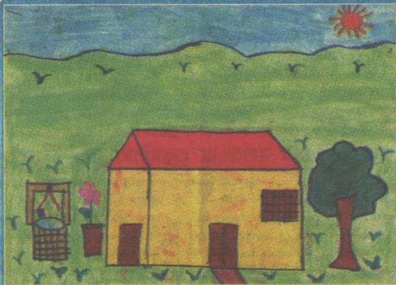
சருமிதா கணேசலிங்கம் தரம் 2A யா/கோப்பாய் நாவலர் தமிழ் வித்தியாலயம்