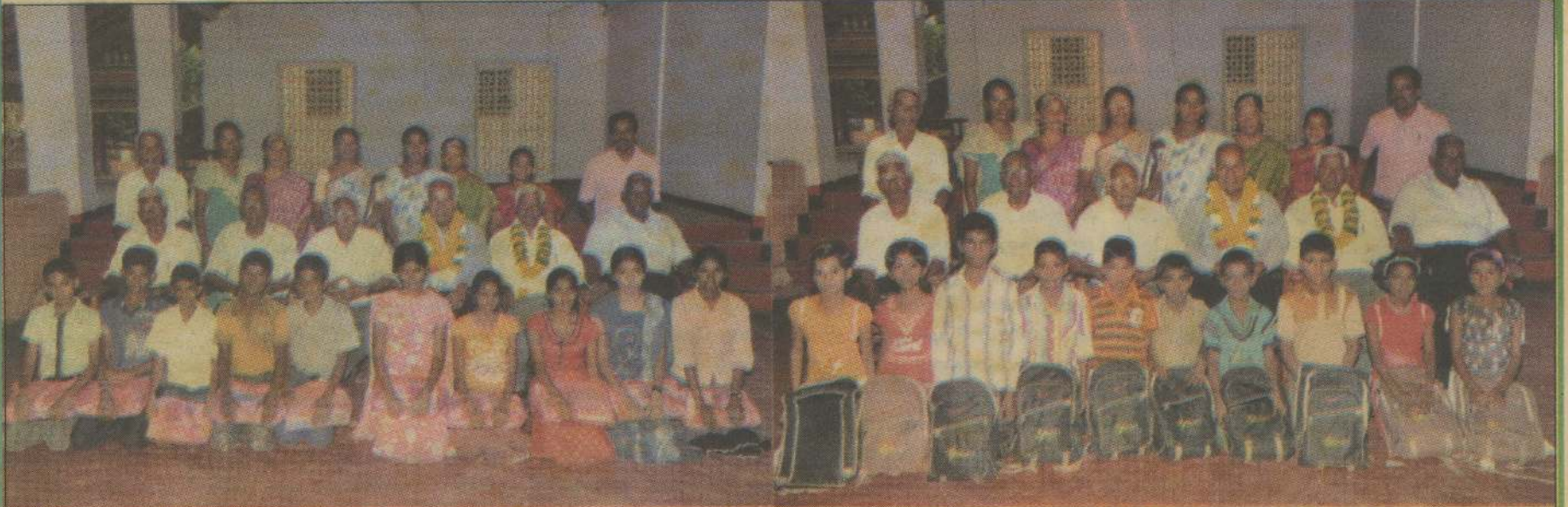
அரியலை அபிவிருத்திச் சங்கத்தின் புலமைப் பரிசில் திட்டத்தில் இணைத்துக் கொள்ளப்பட்ட தரம் 10 மற்றும் தரம் 5 மாணவர்கள், நிர்வாக உறுப்பினர்கள் மற்றும் விருந்தினர்களுடன் நிற்பதை படத்தில் காணலாம்.