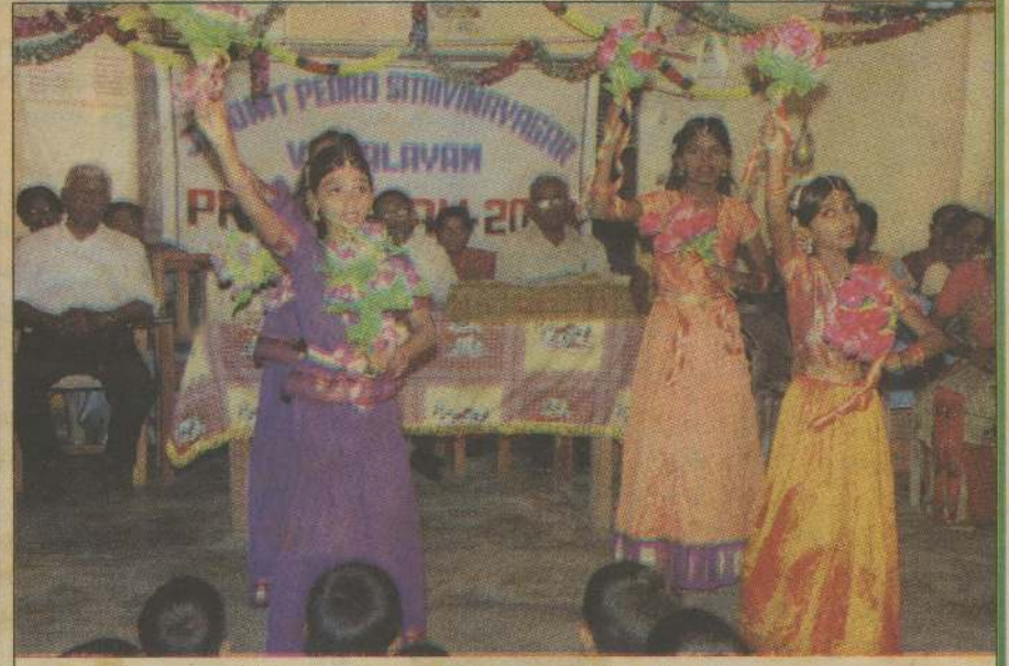
பருத்தித்துறை சித்திவிநாயகர் வித்தியாலயத்தில் பரிசளிப்பு விழா அண்மையில் இடம்பெற்றது. நிகழ்வில் பாடசாலை அதிபர் மற்றும் விருந்தினர்கள் மேடையில் அமர்ந்திருப்பதையும் மாணவிகளின் கலை நிகழ்வையும் படத்தில் காணலாம்.