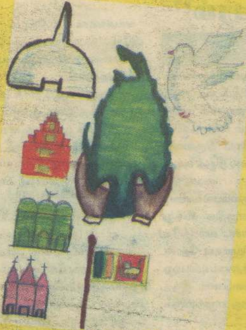
ச.சிவானுஜன் தரம் 7A யா/நெல்லியடி மத்திய மகா வித்தியாலயம்.