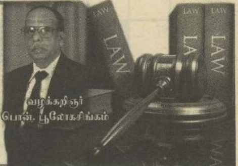
வரல்கர்நி பொன். பூவேசசிங்கம்

PROCE CODE) பிரிவு (SECTION) 439 பின்வருமாறு குறிப்பிடுகின்றது. 'சத்தியக் கடதாசியை முடிப்பவர் பார்வையற்றவராகவோ அல்லது படிப்பற்றவராகவோ நீதிமன்ற மொழியில் பரிச்