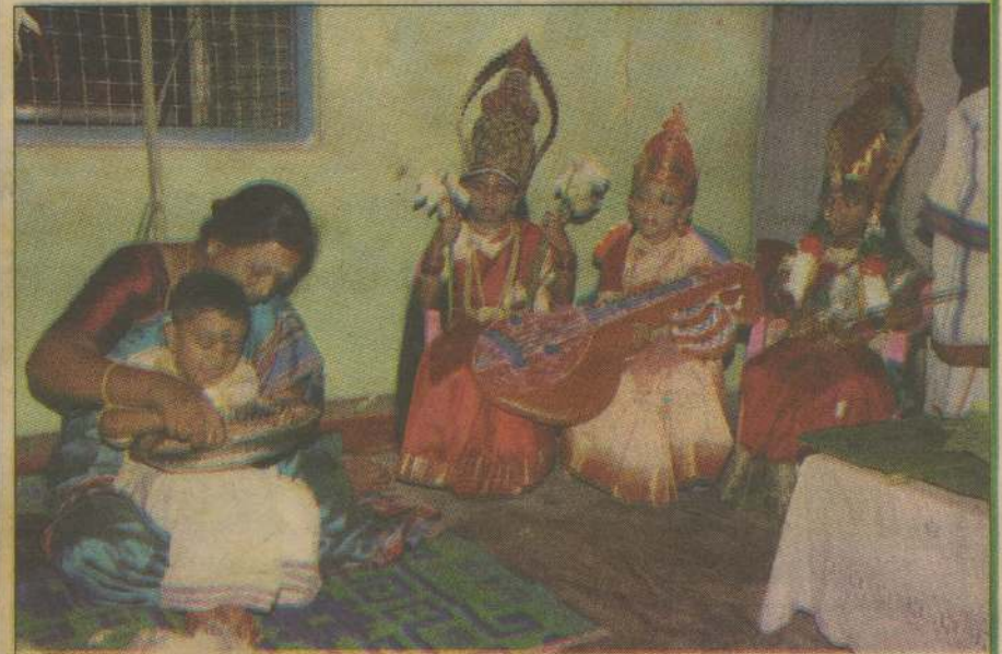
சாவகச்சேரி புவேந்தன் பாலர் பகல்பராமரிப்பு நிலைய நிகழ்வில் சிறுவன் ஒரு வருக்கு ஒரு தொகுப்படுவதையும் பின்னணியில் சிறுமிகள் முப்பெரும் தேவிகளின் உடைய உருவாக்கம் மற்றும் அமர்ந்திருப்பதையும் படத்தில் காணலாம்.