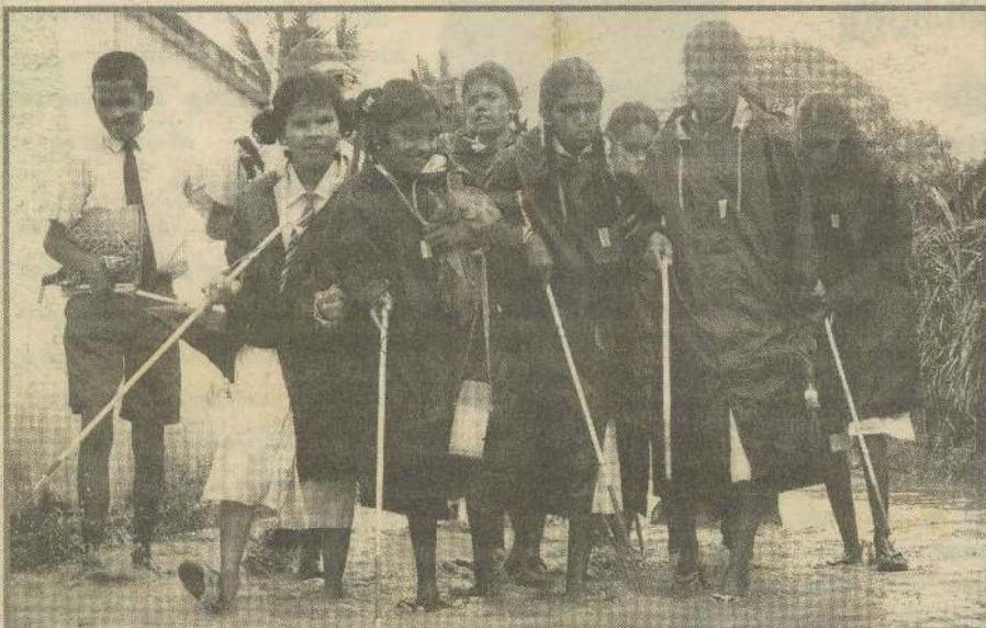
தரிசனம் விழிப்புலனற்ற மாணவ மாணவிகள் கல்வி கற்பதற்கு செல்லும் கல்லூரி வீதி செப்பனிடப்படாமல் மிக மோசமாக பாழடைந்துள்ளது. தற்போது பெய்துவரும் கடும் மழையால் இவர்களின் நிலைமை பரிதாபகரமாக உள்ளது. எனவே உரிய அதிகாரிகளுக்கு கவனம் செலுத்தி எடுத்து விதியை செப்பனிடவேண்டும்.