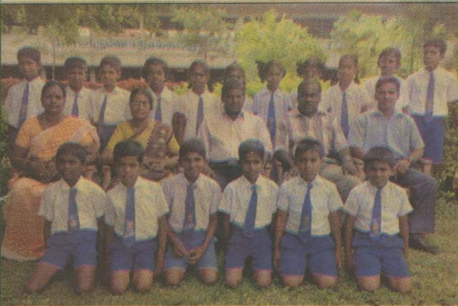
தரம் 5 புலமைப்பரிசில் பரீட்சையில் சித்தியடைந்த அளவெட்டி அருணோதயாக்கல்லூரி மாணவர்கள், அதிபர், ஆசிரியர்களுடன் அமர்ந்திருப்பதை படத்தில் காணலாம்.