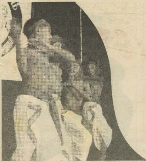
(சென்ற வாரத் தொடர்ச்சி)

தரிசனத்தின் ஊடாக தாலாட்டுப் பாடல்களையும், விளையாட்டுப்பாடலையும், கதைப்பாடலையும், தொழிற்பாடலையும், நோய்ப்பாடலையும், சுற்றத்தார் பெருமை கூறும் பாடல்களையும், ஒப்பாரிப்பாடலையும் எமக்குத் தந்துள்ளது.