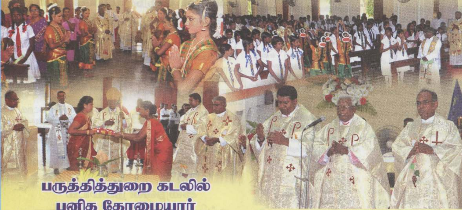
பருத்தித்துறை கடலில் புனித தோமையார்

மாணவச் செல்வங்களோடு யாழ். பேராலயத்தில் ஆயர் தினத் திருப்பலி