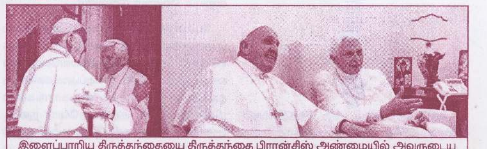
இளைப்பாறிய திருத்தந்தையை திருத்தந்தை பிரான்சிஸ் அண்மையில் அவருடைய கோடை கால விடுமுறை இல்லத்தில் சந்தித்து சுகம் விசாரித்தார்

செப்டம்பர் 19-28 காலப்பகுதியில் கியூபா, அமெரிக்கா, ஈ.நா சபை ஆகியவற்றிற்கும் திருத்தந்தை விஜயம் செய்கிறார்.