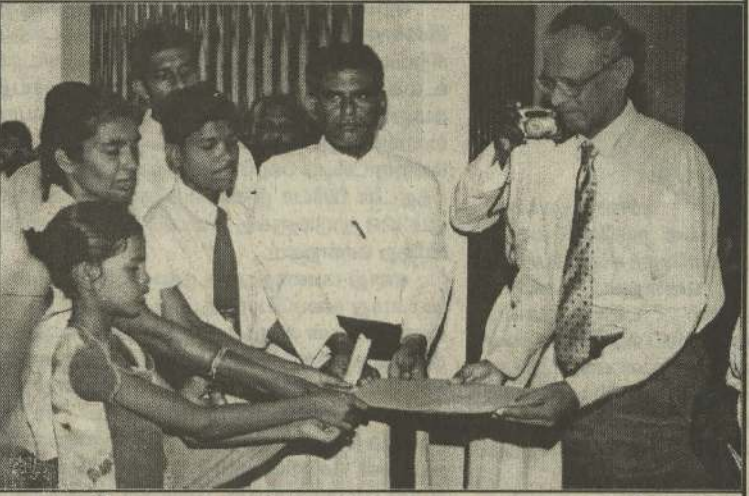
செட்டிகுளத்தில் மாலைநேரக் கல்வி நிலையத்தை திறந்து வைத்து உரையாற்றும் பங்குத் தந்தையுடன் கூடிநிற்கும் மாணவர்கள்