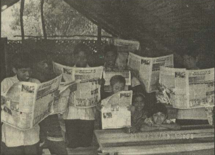
பாதைப் பத்திரிகையை ஆர்வமுடன் படிக்கும் மாணவர்கள்.