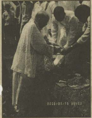
பிரான்சிஸ்கன் அருட்சகோதரர்கள் பங்குதந்ததை, அருட்சகோதரிகள், பங்குமக்கள் இனமத பேதமின்றி மன்னார் மறைமாவட்ட