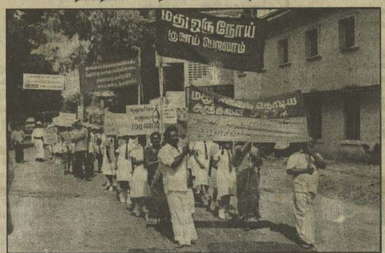
மாணவர் குரல் எழுப்ப, மத்தலைவர்கள் வழிகாட்ட, குருநகர் மக்களே திரண்டு எழுந்து சகோக அடக்கைகளுடன் பிரதான வீதியில் அணிவகுத்து மக்களே விழிப்புடைய அரசுசெய்யக் வரை அணிதிரண்டனர், அறிக்கை சமர்ப்பித்தனர். மிகப்பெருந்தொகையான மக்