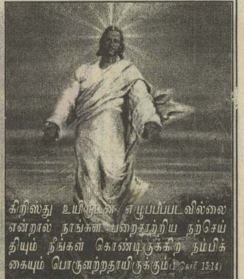
கிறிஸ்து உயிர்ப்புடன் எழுப்பப்படவில்லை என்றால் நாங்கள் பறைசாற்றிய நற்செய்தியும் நீங்கள் கொண்டிருக்கிற நம்பிக்கையும் பொருவற்றதாயிருக்கும். (1 சர் 15:14)

அபகரிப்பு, அதிகாரத்தனம் அபாண்டப் பழிகளால் கருச்சிதைவுகள், மறைவான கொலைகள், வதந்திப் பேச்சுக்கள் எங்கள் நிலைகளைத் தாண்டி போலி முகமூடிகள் போட்டு தெரிந்தும், தவறுகளைத் தொடர்ந்தும் செய்யும் போது எமது செயல்களே கசையடி, மூள்முடி, சிலுவைக்கொலைகளாக எண்ணத்தால், செயல்களால் தினமும் பாவச்சுமைகளை சுமத்த சிலுவைச் சாவுக்கு இழுத்துச் செல்கிறோம் இக்காலத்தில் எம்மைப் புடமிட எப்போ சந்தர்ப்பம் கொடுத்தோம்