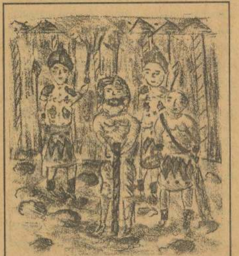
பெயர்: F.X.வினுஷன் சென்.பற்றிக்ஸ் கல்லூரி

இளைஞரே உன் சிறப்பை வெளிப்படுத்த இதுவே தருணம். இன்று செய்ய வேண்டியதை நாளை எனத் தள்ளிப் போடாதே. எது நல்லதோ எது சமூகத்துக்கும் உனக்கும் பயனுள்ளதோ அதனை ஆன்மீக விழுமியங்கள் மிளிர்வும் உன்னிடம் சமூகம் எதிர்பார்க்கும் சிறப்பை வெளிப்படுத்தி உன் பொறுப்பை வெளிப்படுத்து இதுவே உன் அடையாளமாகட்டும்.