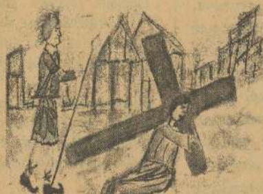
Name: Y. Limojan