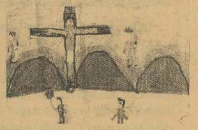
Name: A. Arnoald