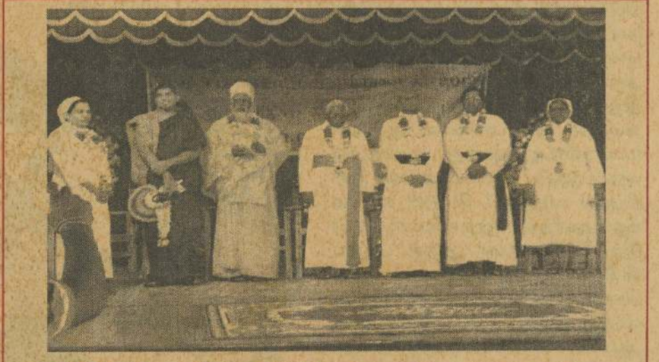
அ.ம.தி.களின் சிறுவர் இளையோர் மகாநாட்டில் கலந்துகொண்ட மதத்தலைவர்களைக் காணலாம்.

சந்தர்ப்பங்கள் ஏற்படுத்துவதில் சகல மட்டத்திலும் முன்னிற்க வேண்டியது காலத்தின் தேவையாகும். குறைகளைக் சுறி, நிறைகளை வெளிப்படுத்த சந்தர்ப்பங்களை ஏற்படுத்தாத திருவிழாக்கள், சமூக அமைப்புகளின் செயற்பாடுகள், சிறுவர் இளையோரின் மன நெருக்கீடுகளை அறியவோ அவர்களின் ஆற்றல் திறன்களைத் தூண்டவோ, நம்பிக்கை வாழ்வை தூண்டவோ சந்தர்ப்பங்கள் ஏற்படுத்தப்படாத வரை சமூக சீரின்மையைத் தவிர்க்க முடியாது. சமுதாயத்தை வழிநடத்தும் தனிநபர்கள், குடும்பங்கள் அமைப்புக்கள், வழிகாட்டிகளின் நல்முயற்சிகள் நல்லுற வாடல்கள் உள்ள சமூகத்தைக் கட்டி யெழுப்பும் சூழலில் ஆரோக்கியமான ஆன்மீக விழுமியங்களைக் கொண்ட நற்சமூகத்தைக் கட்டியெழுப்ப முடியும் என்ற நன்னோக்கு ஒளிரும் திரிகளாக சமூகமே பிரகாசமான நற்சமூகத்தை உருவாக்க இம்மாநாடு சிறந்தோங்க வாழ்த்துகிறோம்.