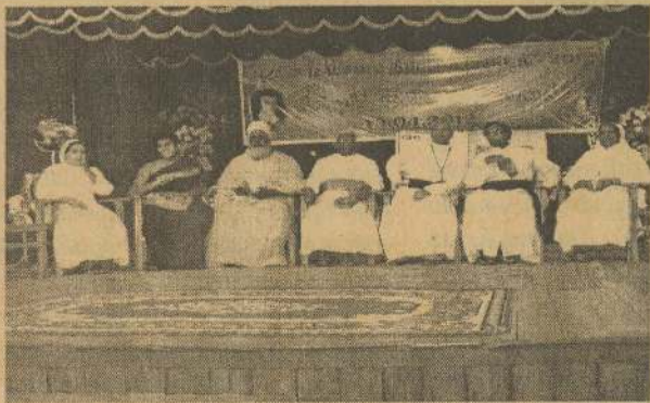
The 150th Anniversary of the heavenly birth of St. Eugene De Maxenod, The founder of OMI congregation at St. Patrick's College on the 19th of April 2012