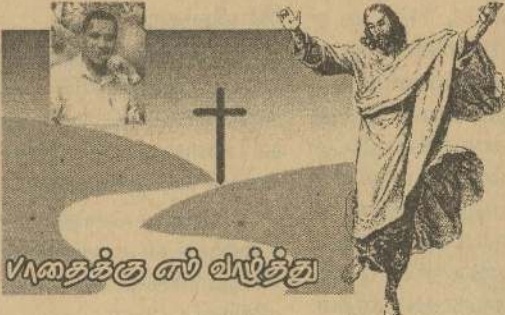
போதைக்கு ஸ் வழுத்து

ஒரு தசாப்தங்களை வெற்றி யோடு முடித்து வீறுநடை போடும் "பாதை பத்திரிகைக்கு எமது வாழ்த்துக்கள் தொழில்நுட்ப வளர்ச்சியால் உலகம் சுருங்கிப் போய்விட்ட இக் காலத்தில் கிறிஸ்தவ பத்திரிகை ஒன்றை தொடர்ச்சியாக வெளியிடுவது சாதனையான செயல். ஏதேன் தோட்டத்தின் நடுவில் உள்ளம் மரம் "உண்பதற்குச் சுவையான காயும் கண்களுக்குக் களிப்பூட்டுவதாகவும் அறிவு பெறுவதற்கு விரும்பத் தக்கதாகவும் இருந்தது..." (தொ.நூல் 2:6) பாவம் மனுக்குலத்தில் பெருக இதுவே காரணமாக அமைந்தது. கவர்ச்சி மனுக்குலத்தை வீழ்த்தியது. ஊடகங்களும் போட்டி போட்டு மக்கள் மனதில் இடத்தைப் பிடிக்க கவர்ச்சியாக வெளியிடுகின்றன. இந்தப் போட்டித் தன்மைக்குள் இயேசு கிறிஸ்துவின் "பாதை" தான் உலகில் சிறந்த "பாதை" அதில் யாத்திரை செல்வதுதான் மகிமையான வாழ்வு என்பதை "பாதை" பத்திரிகை சுட்டும். இயேசுவின் "பாதை" கவர்ச்சி அற்றது. துன்பம் நிறைந்தது. கரடுமுரடான கொல்கொதா நோக்கியது. இயேசுவின் "பாதை" சிலுவை "பாதை". இந்தப் "பாதை" யில் செல்வது கடினம். ஆனால் இப்பாதையில் தான் உயிர்ப்பு என்ற மறைபொருள் உண்டு. உயிர்ப்பு என்ற மரிமை மாட்சிமை உண்டு. "பாதை" வாசகன் இயேசுவின் "பாதை"யில் செல்ல எம் வாழ்த்துக்கள். "பாதை" பத்திரிகை குழுவினருக்கு எம் வாழ்த்துக்கள். இறையாசீர் என்றும் உங்களுடன் இருக்க யாசிக்கின்றோம். ஈ.ஓ. சூலீந்தர் ஆசிரியர் - சென்னை