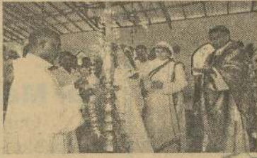
காலியில் உறுதிப் பூசுதல் பெற்ற மக்களோடு காலி ஆயரும் பங்குத் தந்தையும் அன்னை திரேசா சபை சகோதரிகளும் கூடி மகிழும் காட்சி