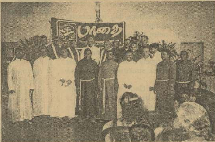
10 ஆண்டுகளின் முன் மாத்தளை பிரான்சிஸ்கன் சபை ஆலயத்தில் "பாதை" அறிமுகத்தில் சகல அருட்சகோதரர்களுடன் மன்னார் ஆயரும் இணைந்து நிற்கும் காட்சி