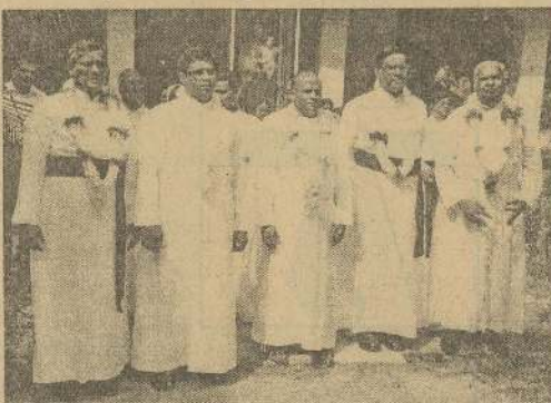
பிரான்சீஸ்கன் சகோதர சபையினர் 2011ம் ஆண்டு இளவாலை சென்யோசப் விடுதியை பெறுப்பேற்கும் நிகழ்வில் யாழ் குரு முதல்வரும் கென்றிஸ் அதிபருடன் விருதி மாணவர்களும் சபை சகோதரர்களை வரவேற்கும் காட்சி.

நல் மனங்களின் ஒத்துழைப்பும் உபசரிப்பும் மாணவ செல்வங்களின் முன்னேற்றத்தில் காட்டும் அதிபர், ஆசிரியர்கள் காட்டும் அக்கறையும் பல சாதனைகளை புதிவாக்கியது பெரும் சிறப்பாகும்.