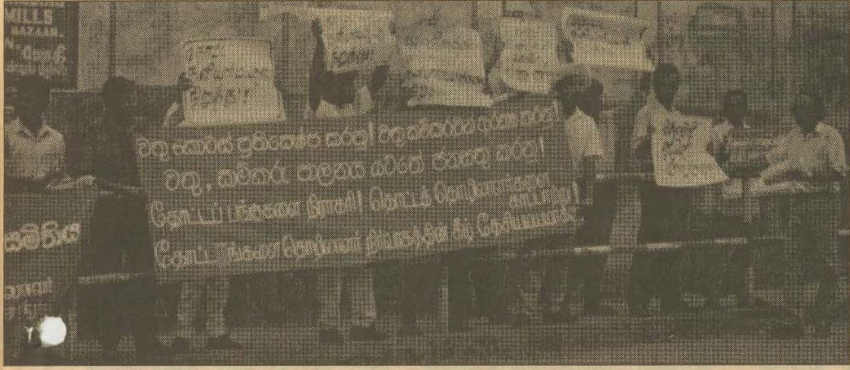
தோட்டப் பகுதி அரசியல் சைதிகளை விடுதலை செய்யுமாறு பி.க.க. அட்டனில் நடத்திய மறியல் போராட்டத்தின் ஒரு பகுதி