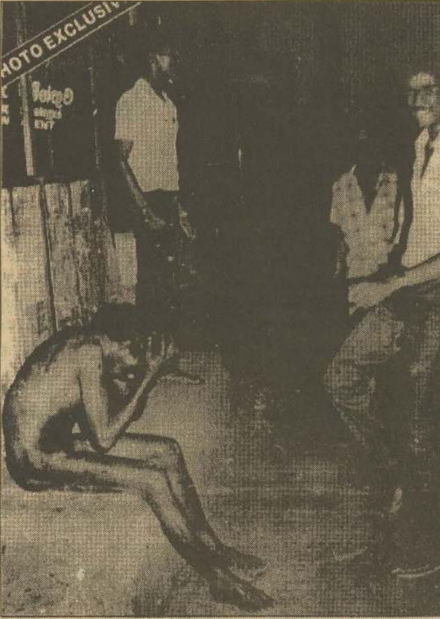
1983 ஜூன் இனக்கலவரத்தின் போது பொருளையில் இனவாத காரணம் பொது குண்டர்களால் தாக்கப்படும் தமிழ் இளைஞன்

புதிய இராக்கத்தை இடைக்கத் தொடங்கினர். அதாவது "1970 மக்கள் வெற்றியை காப்பதற்கும் அதை முன்னெடுப்பதற்கும் அரசாங்கத்தை பலப்படுத்தும் இயக்கத்தை கட்டியெழுப்ப வேண்டும்" என்ற வேட்டைத் தீர்த்தனர்.