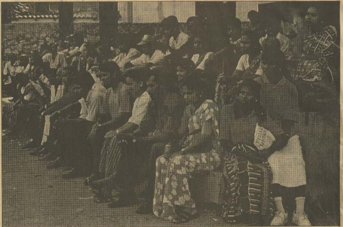
கொட்டாஞ்சேனை இரத்தினம் மைதானத்தில் இடம்பெற்ற சோ.ச.க. மே தின கூட்டத்துக்கு வருகைத்தேரவில் ஒரு பகுதியினர்.

சோசலிச சமத்துவக் கட்சியின் வங்குரோத்தினை ஊர்வலம் சம்பந்தமாக சகல முதலாளித்துவ மீண்டும்