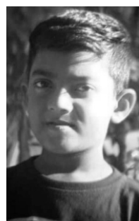
வசந்தன் வரஜிகள் 149 புள்ளிகள்